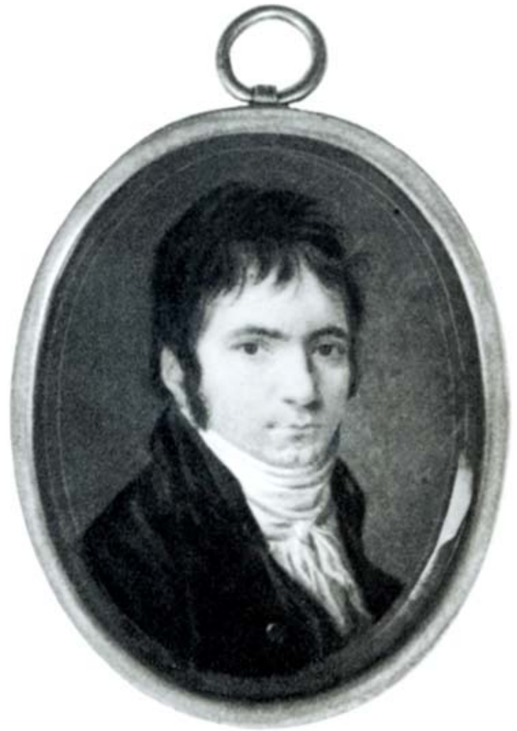
Ludwig van Beethoven. Miniatuur van Christian Horneman.