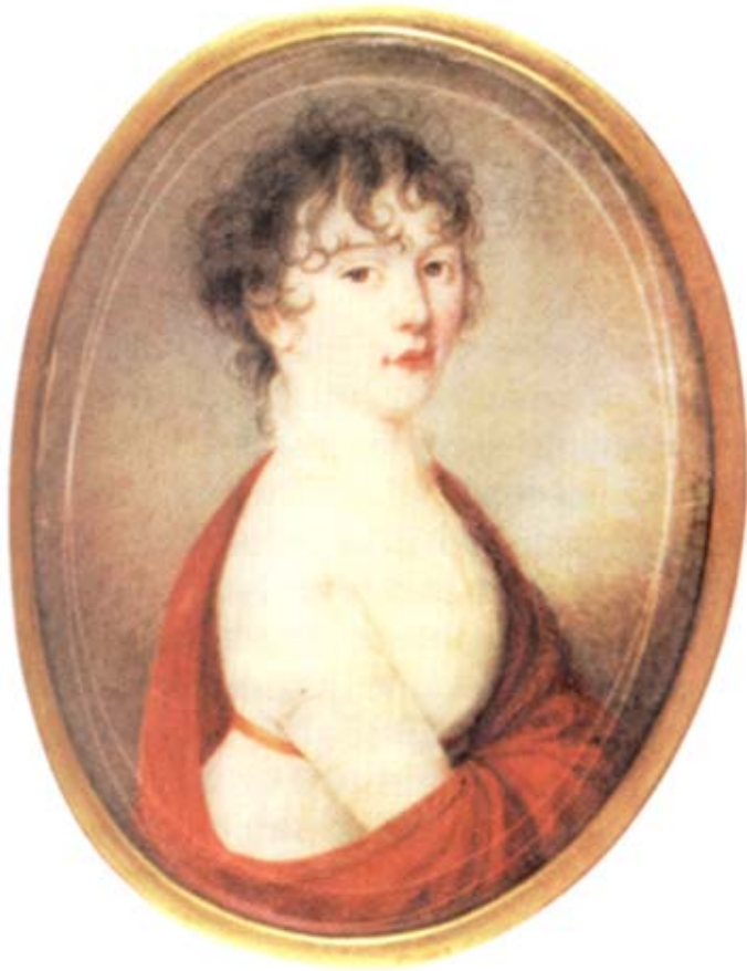
Gravin Giuletta Guicciardi. Aan haar wijdde Beethoven zijn 'Mondschein-Sonate'.