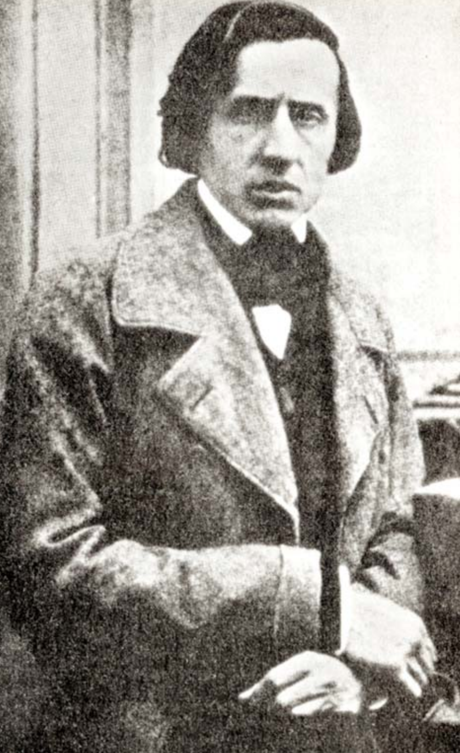
Frédéric Chopin in 1849

gen een structuur op poten te zetten en tegelijk binnen het zelfopgelegde kader toch vrij te blijven. Bij Chopin blijft de initiële gedachte onaangeroerd en haarscherp. Ze is immers persoonlijk, ze is ernstig en heeft een duidelijk potentieel aan diepzinnigheid. Ze mag dus blijven.