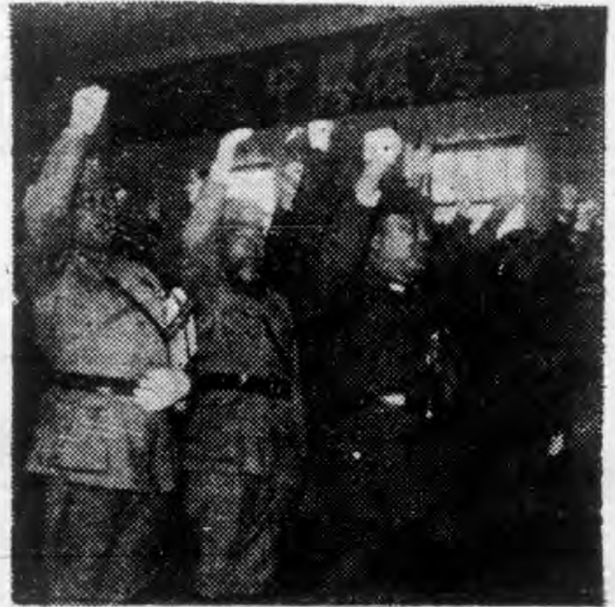
中央陸軍訓練團畢業典禮