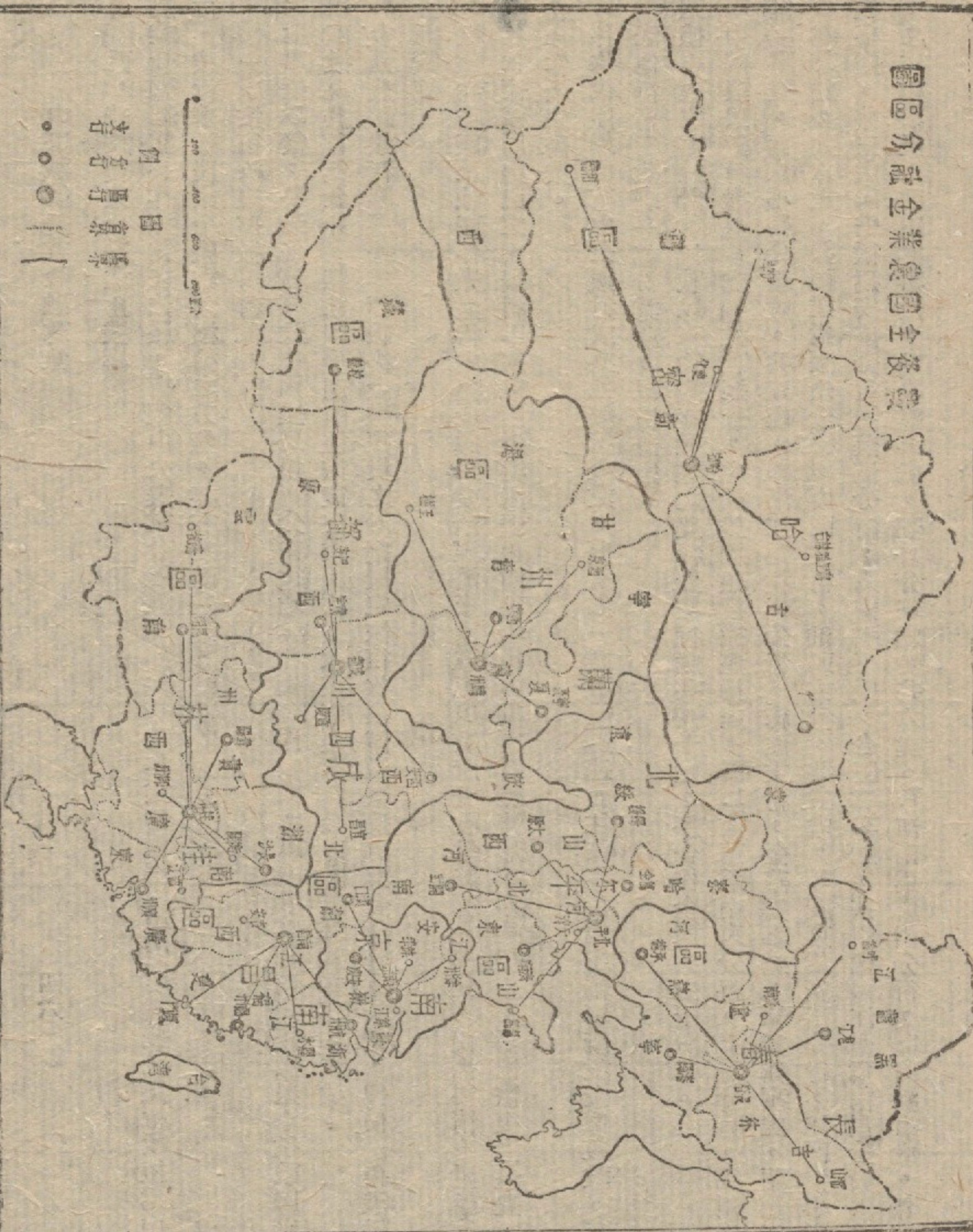
中國戰後農業金融政策四五頁插圖