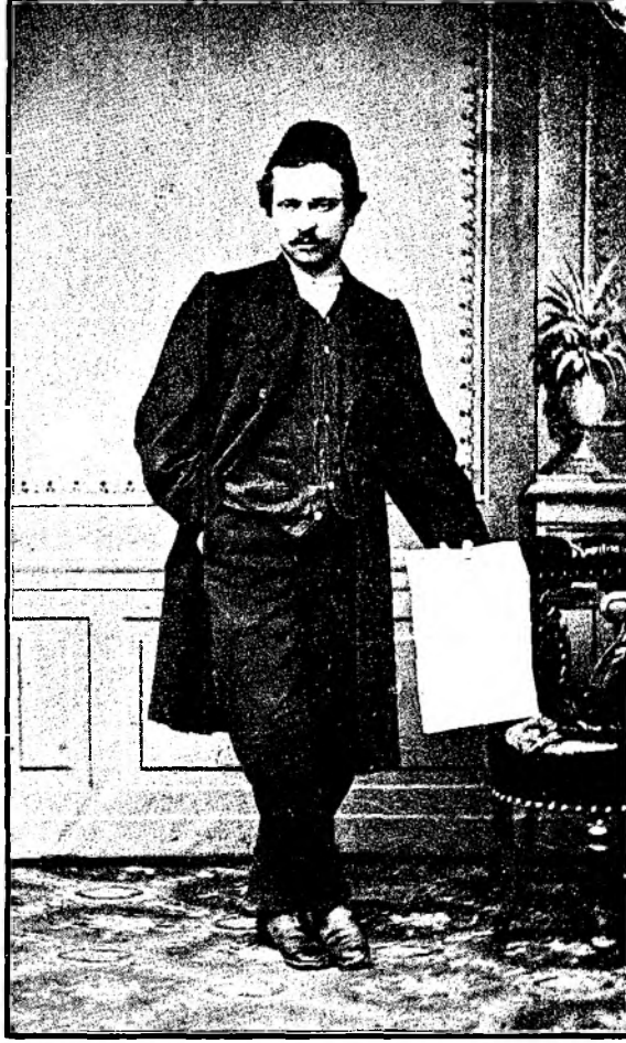
Namık Kemal "Tasviri Efkâr muharriri