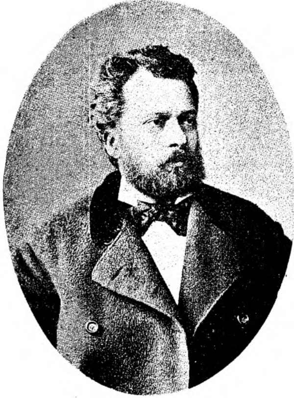
Namık Kemal Midilli adasına nefyolunduđu zaman