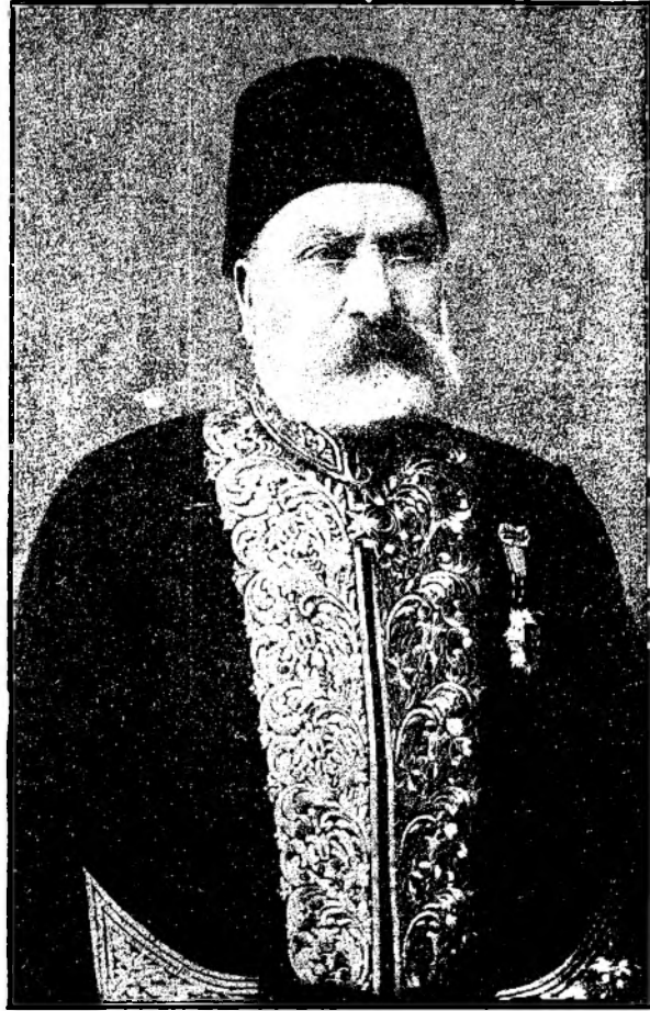
Mustafa Asım Bey