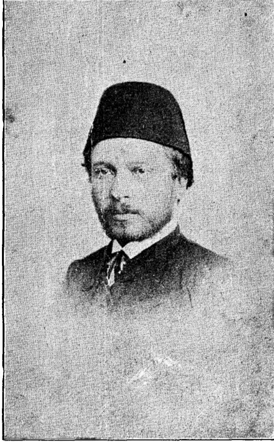
Namık Kemal Avrupadan avdet ettiği zaman