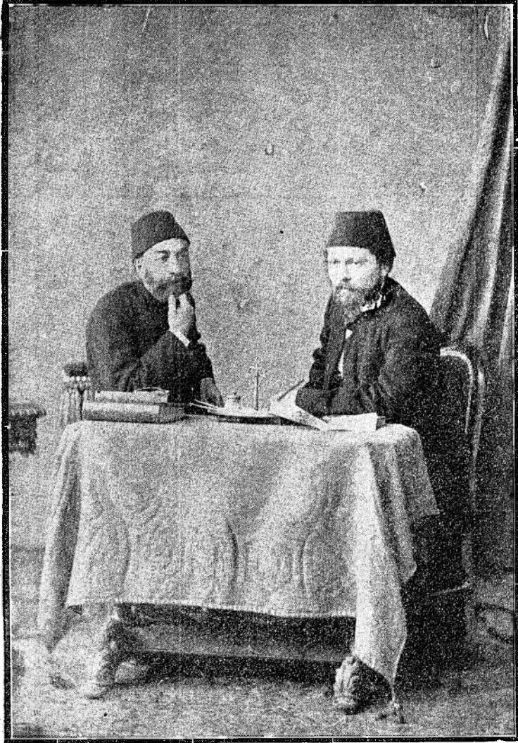
Ziya Paşa ve Namık Kemal Kanunu Esasi Encümeninde