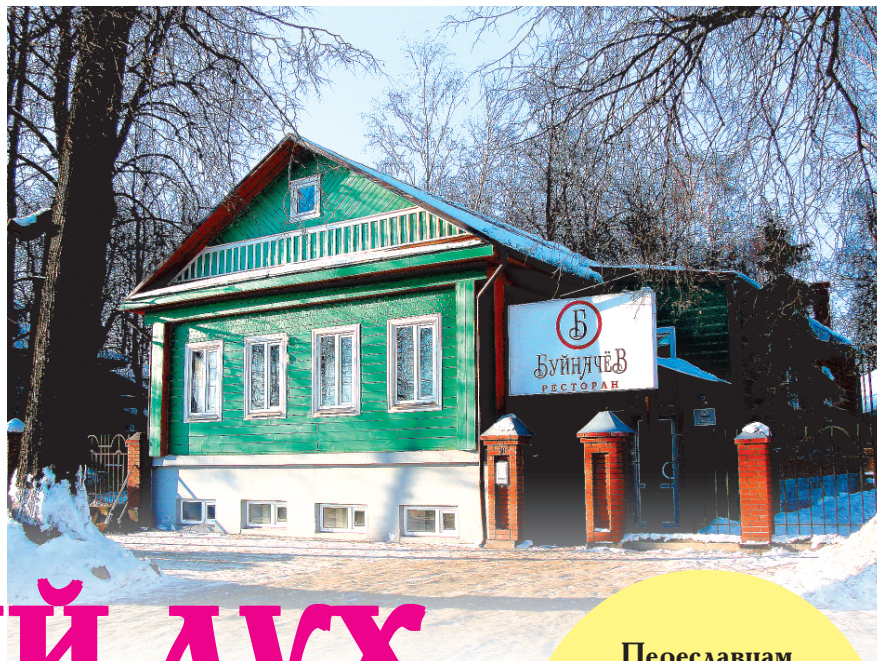
Переславцам на заметку