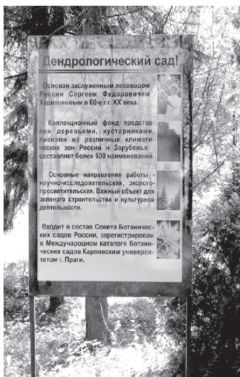
Дендрологический сад им. С.Ф. Харитоновой

• 55 лет назад на экраны вышел фильм «Коммунист», натурные съемки в котором происходили в Переславле (1957).