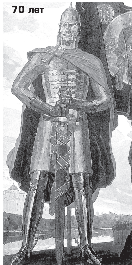
Центральная часть триптиха «Александр Невский». П. Корин. 1942.