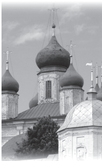
Успенский собор Горичьего монастыря