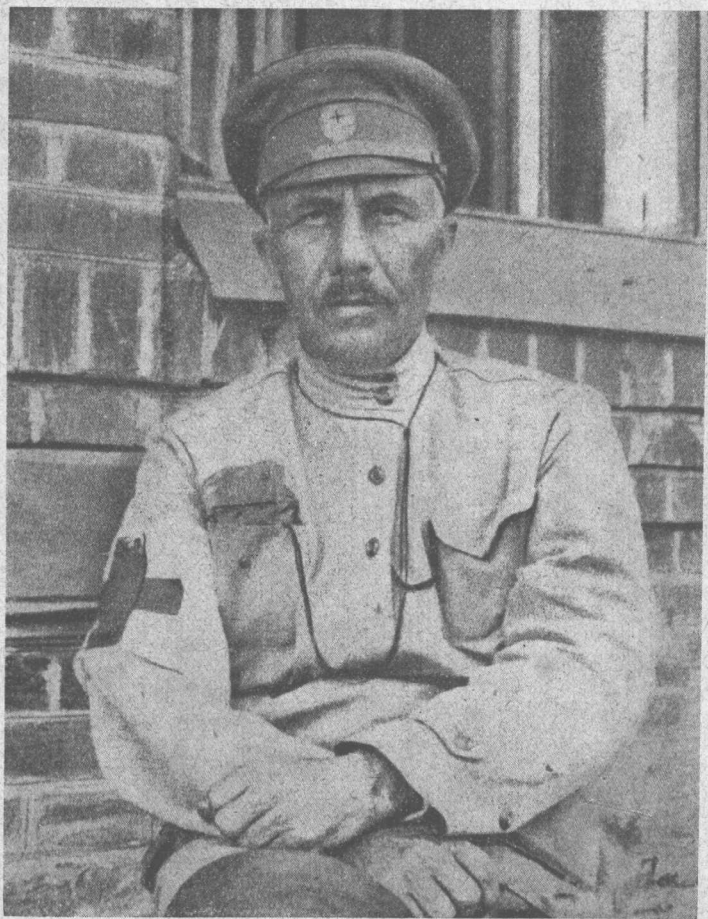
戰場上的綏拉菲摩維支