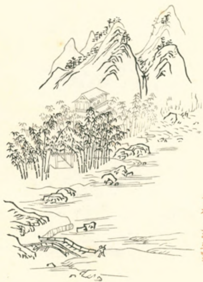
八門穿竹徑田畝所 山泉 十村空寫