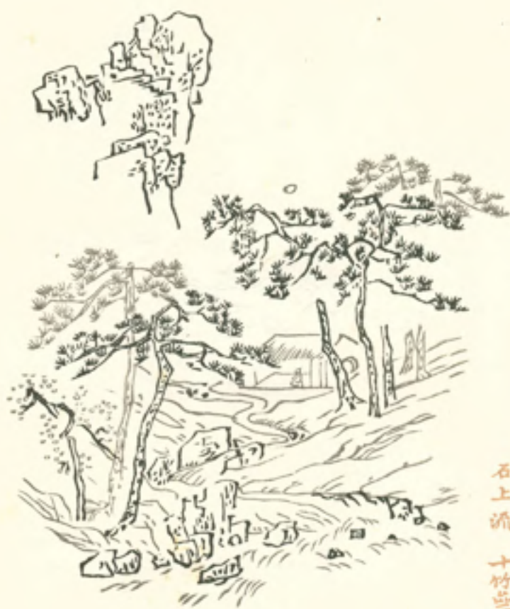
明月松間始清泉 石上流 十竹齋寫