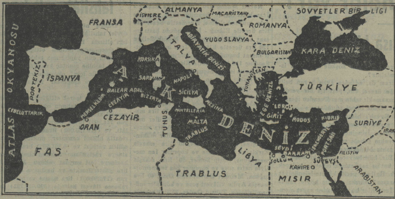
Akdeniz vaziyetini, Mısır'da taarruza uğrıyan mntakaları gösterir harita

— Bundan on sene kadar evel, almanlar, nazilik denen bir nevi dine kulak verdiler. Naziler, fevkalâde bir vatanperverlik ileri süren ve hükümet sürmek için hususi liyakate sahip olmakla tefahür eden bir avuç adamla daha iyi bir hükümet vâdeyliyen bir ekalliyet idi. Serbest seçimlerin istikbalde ortadan kaldırılacağı hakkında Almanya'da hiç bir şey söylenmedi ve büyük ticaret ve sanayide menfaatlari bulunan birçok şahıslar, politik ve ekonomik bakımlardan, bu yeni dinle işbirliği yaptılar. Sizler ve ben; Almanya'nın bundan sonra tarihini biliyoruz. Bizim hükümet gelişimizin devamlı emniyeti, serbest seçimlerin idamesi üzerine müessesdir.