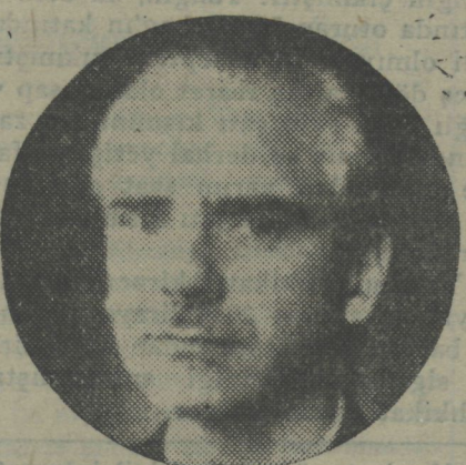
İspanya dahiliye nazırı B. Serrano Suner

Roma, 21. a.a. — D. N. B. : Roma siyasi mahfillerinde, B. Serrano Suner'in pek yakında Roma'yı ziyaret edeceği söylenmektedir. Bu hususta resmi hiçbir haber mevcut olmamakla beraber, B. Serrano'nun, Almanya'dan dönüşünde İspanya'ya Roma yolu ile gideceği sanılmaktadır.