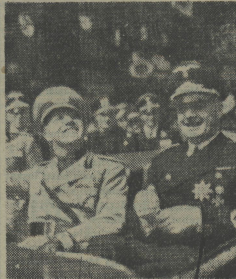
Von Ribbentrop kont Ciano ile beraber

Roma, 21. a.a. — D. N. B. : Roma siyasi mahfillerinde, B. Serrano Suner'in pek yakında Roma'yı ziyaret edeceği söylenmektedir. Bu hususta resmi hiçbir haber mevcut olmamakla beraber, B. Serrano'nun, Almanya'dan dönüşünde İspanya'ya Roma yolu ile gideceği sanılmaktadır.