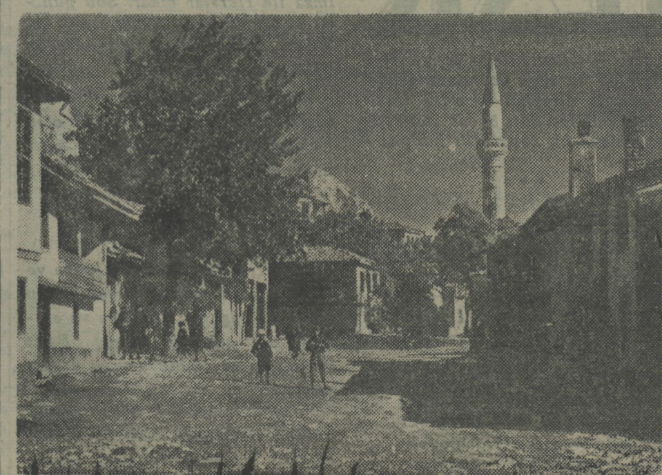
Dün bulgarlar tarafından işgale başlanan Dobruca'dan bir manzara : Balçık kasabası

Sofya, 21. a.a. — Bulgar ajansı bildiriyor : Kral Boris, bulgar kıtalarının Dobrucaya girmesi münasebetiyle millete hitaben aşağıdaki beyannameye neşretmiştir : Bulgarlar.. 7 Eylül 1940 da Krajovada Bulgaristanla Romanya arasında imza edilen muahede mucibince eski hudut tekrar teessüs etmiş ve Dobruca Bulgaristanla dönmüştür. Kahraman kıtaya aziz bulgar köşesini işgal için emir verdim ve sevgili milletime bu mesut hâdiseyi bildiririm. Bu dakikayı, istikbale çevrilmiş bir azim ve irade ve adaletin zaferine olan sarsılmaz bir ümitle bekledik. Mülmetperver gayretimiz ve müteyakız sabrımız mükâfalandı. Dobruca tekrar bizim oluyor. Ana yurda aydınlarımızın bin kin tohumu, bir in-tikam arzusu bırakmıyacak ve fakat (Sonu 3 üncü sayfa)