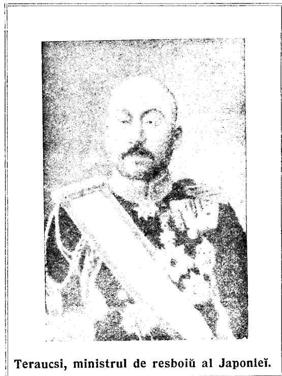
Terauci, ministrul de resboiū al Japoniei.