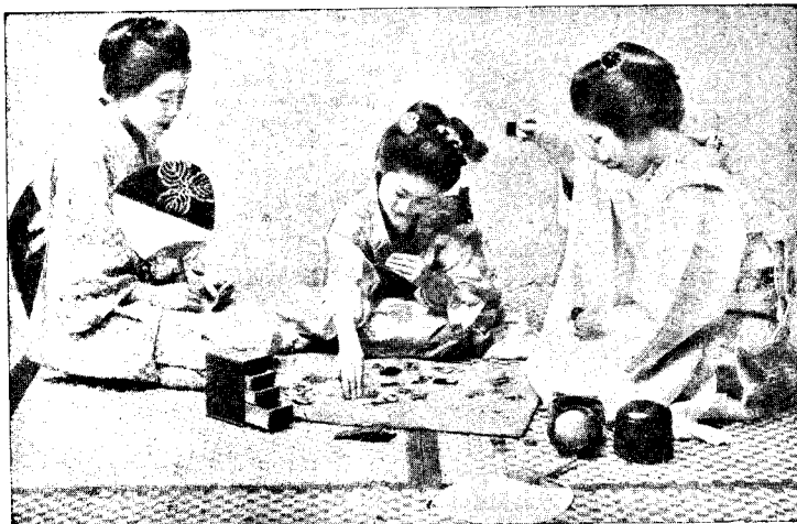
Damele de curte ale împărătesei Japoniei.