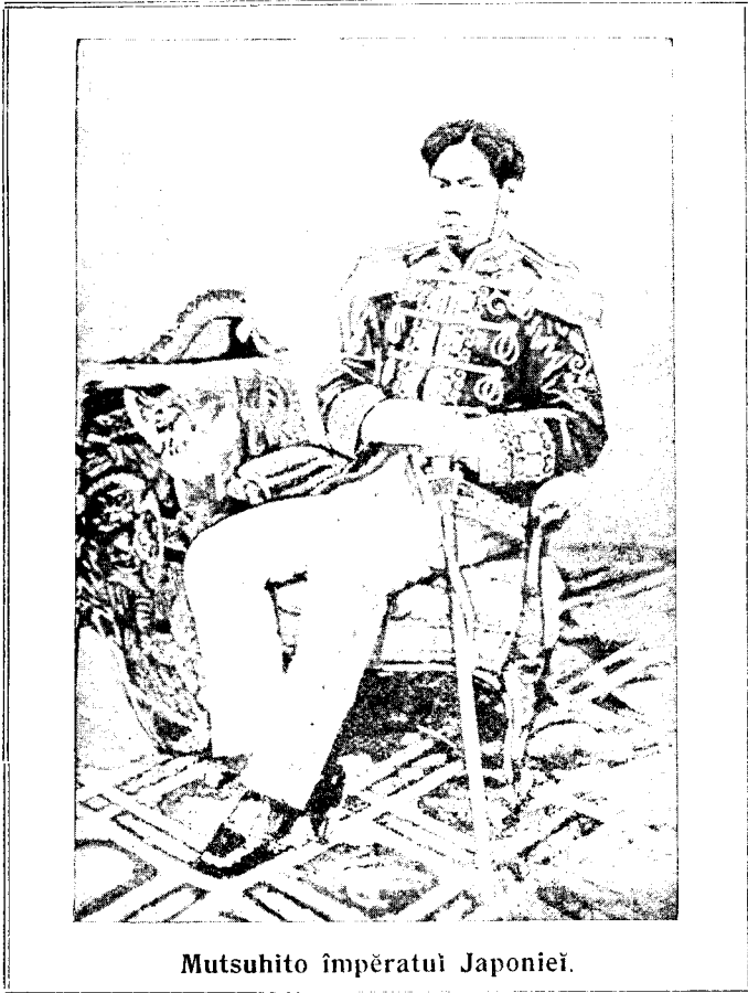
Mutsuhito împăratul Japoniei.

eū mai mult, cu atâta vorbiiū acuma despre diferite lucruri.