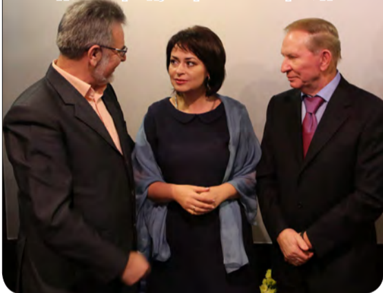
Л.Д.Кучма разом із М.І.Гаденком та Т.Мудрою, членами журі фестивалів «Соловейко України» та «Доля», які проходять під патронатом благодійного фонду «Україна» экс-президента.

концертні зустрічі з численними глядачами. Невдовзі з'явилися власні вірші, які допоміг перетворити у співану поезію її творчий батько, поет, композитор, співзасновник багатьох Всеукраїнських та міжнародних фестивалів, народний артист України Мар'ян Гаденко. Дебют Т.Мудрої, уже як автора та виконавиці, відбувся у 2010 році в рамках Всеукраїнського пісенно-поетичного фестивалю «Рідна мати моя» (м.Обухів). А в 2013 році Тетяна стала переможцем цього ж конкурсу як автор пісні «Батьки», котру виконала актриса театру і кіно, солістка ансамблю пісні і танцю МВС України Ганна Петраш. Незабаром Тетяні запропонували стати членом Асоціації діячів естрадного мистецтва України. А згодом, відповідним рішенням комісії, Тетяні Анатоліївні Мудрої було присвоєне звання заслуженої артистки естрадного мистецтва України.