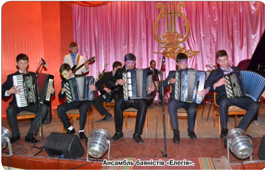
Ансамбль баяністів «Елегія».