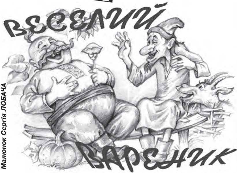
Малюнок Сергія ЛОБАЧА