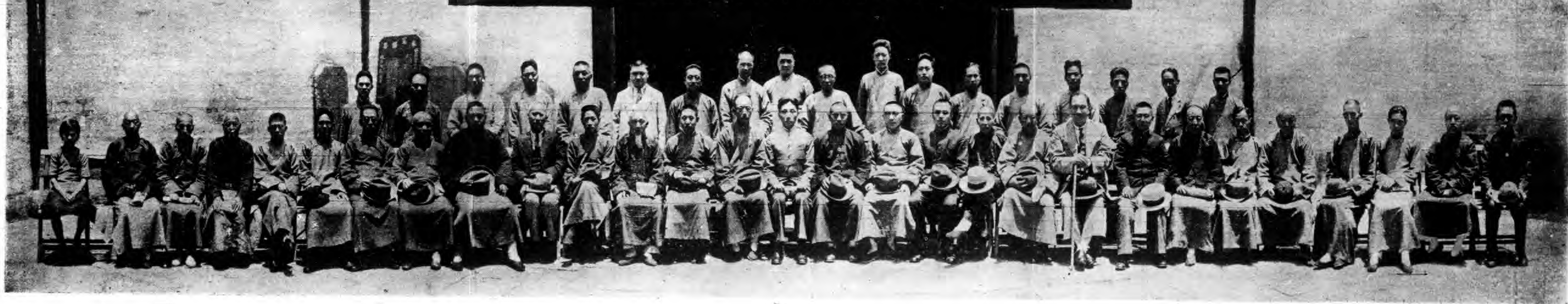
鄞縣政務第九屆行政會議開幕典禮攝影紀念 二十三年五月二十八日