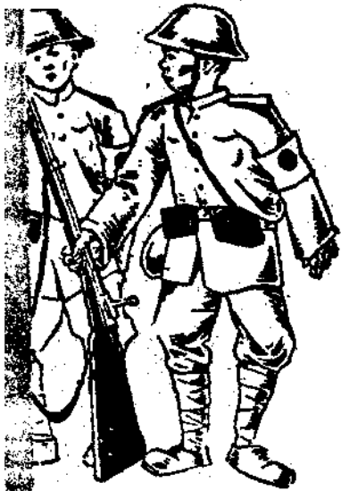
十五六 歲男子 執槍當 兵，可 見徵兵 處已無