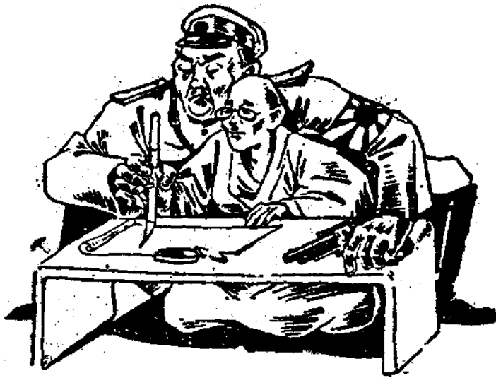
反戰聲中的日本 天野作

○論失，部迎，有息步或反極論日制軍 自却完意合必發，利軍單力界方下閱 由言全旨年須表所消事免避，言的統