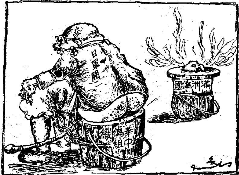
日本軍閥之特長工作 黃幻烏作