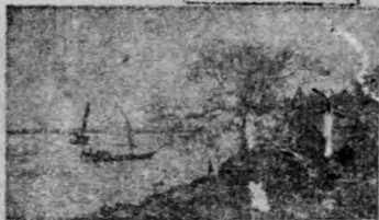
(一) 景州橋頭(協和大學) 帆江望