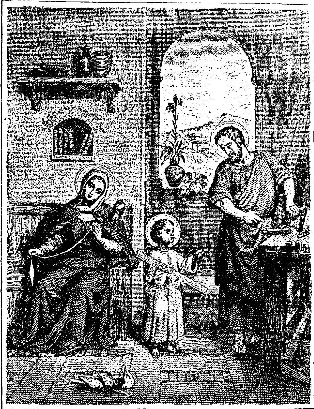
聖 家 像