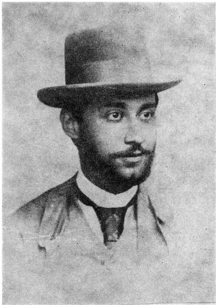
N. Iorga, la vîrsta de 29 ani