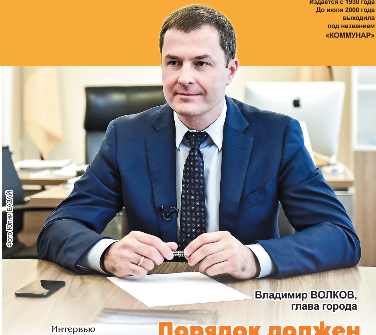
Владимир ВОЛКОВ, глава города

«АЛЬТАИР» Звоните 3-45-00 В СЛУЧАЕ ПРОТИВОПОКАЗАНИЙ ПРОКОНСУЛЬТИРУЙТЕСЬ У СПЕЦИАЛИСТА