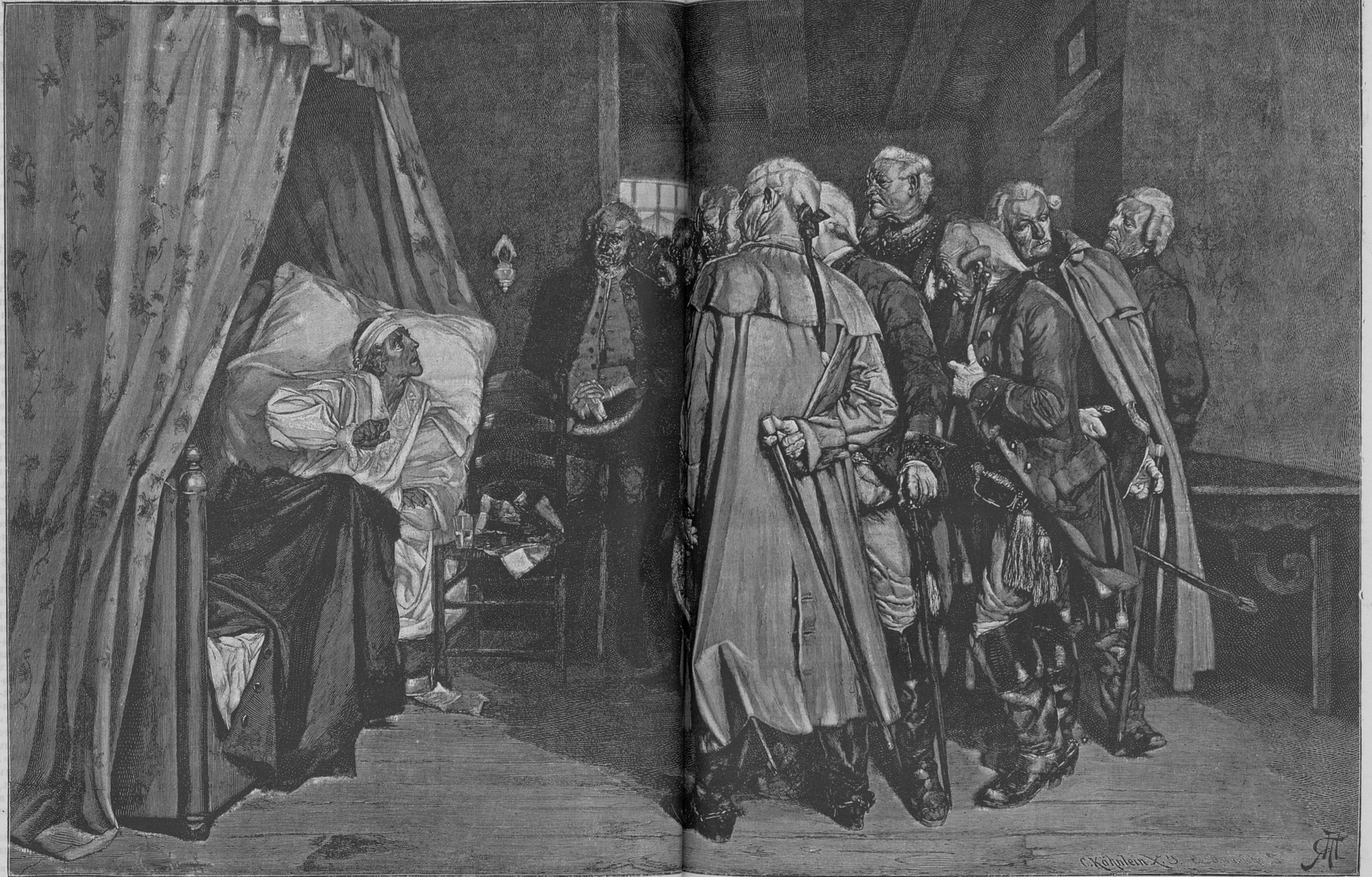
Рѣчь Фридриха Великаго къ своимъ генераламъ послѣ битвы при Куннерсдорфѣ въ 1759 г. (съ картины Артура Кампфа).