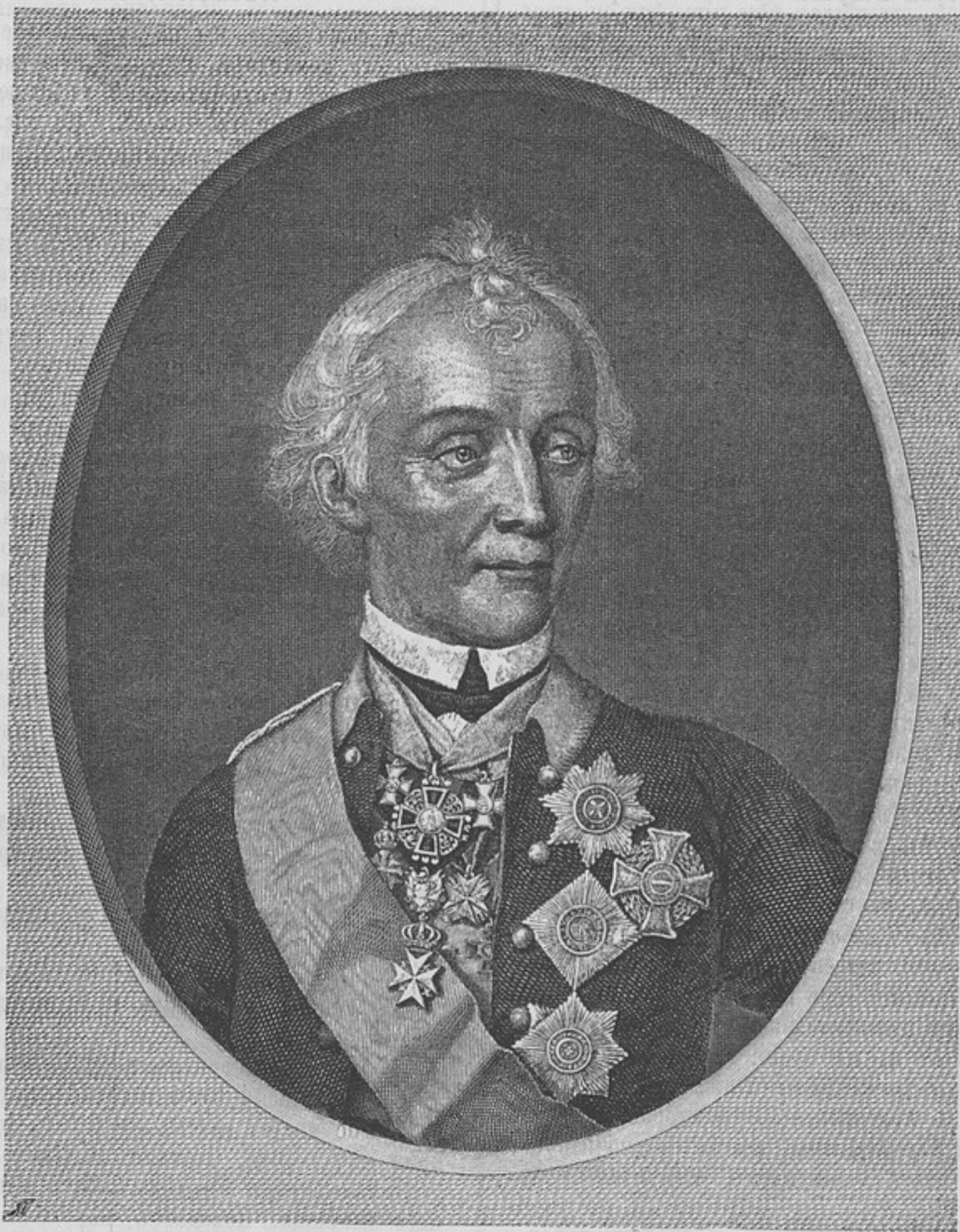
Суворовъ. Гравироваль Н. Уткинъ, съ портрета писаннаго Шмитомъ, живописцемъ Курфирста Саксонскаго, въ 1799 года.