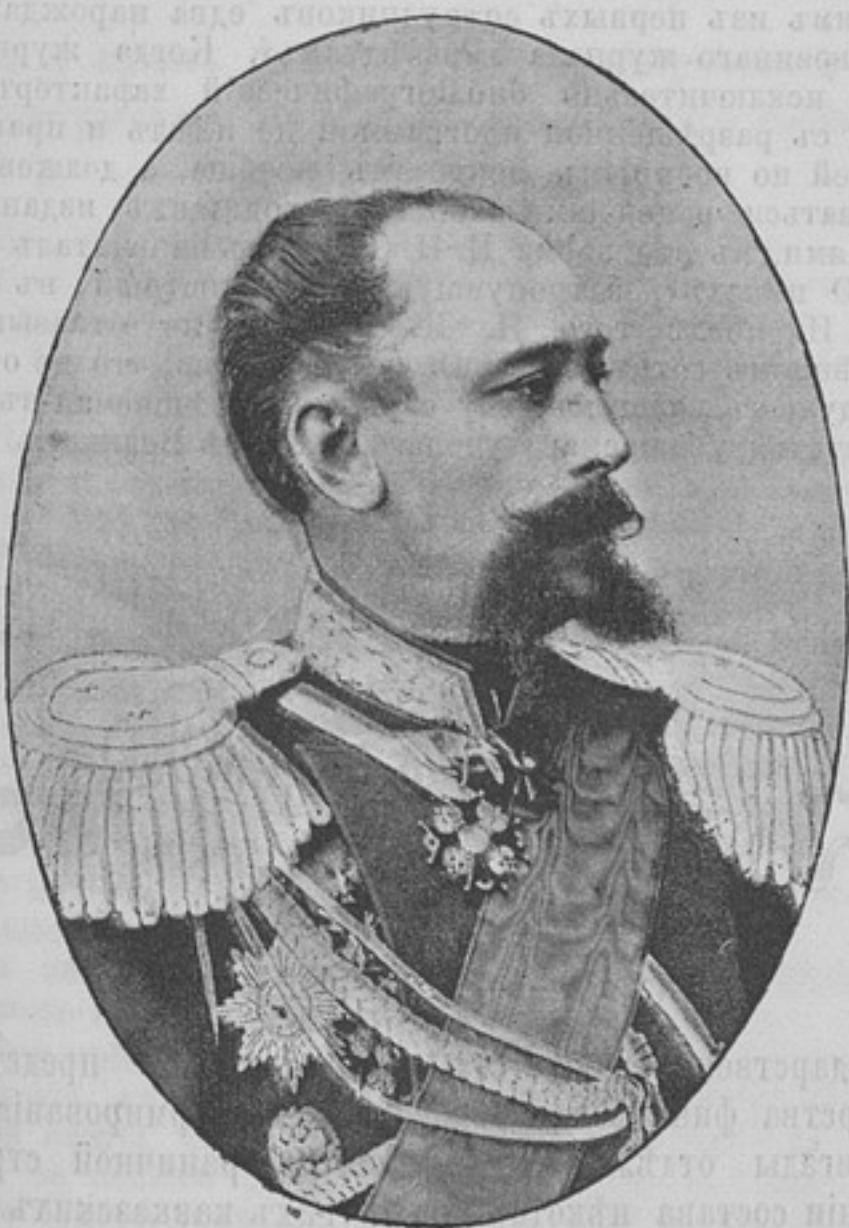
Командующій 3-й кавалерійской дивизіей и заслуженный профессоръ Николаев- ской академіи генеральнаго штаба, генераль-маіоръ