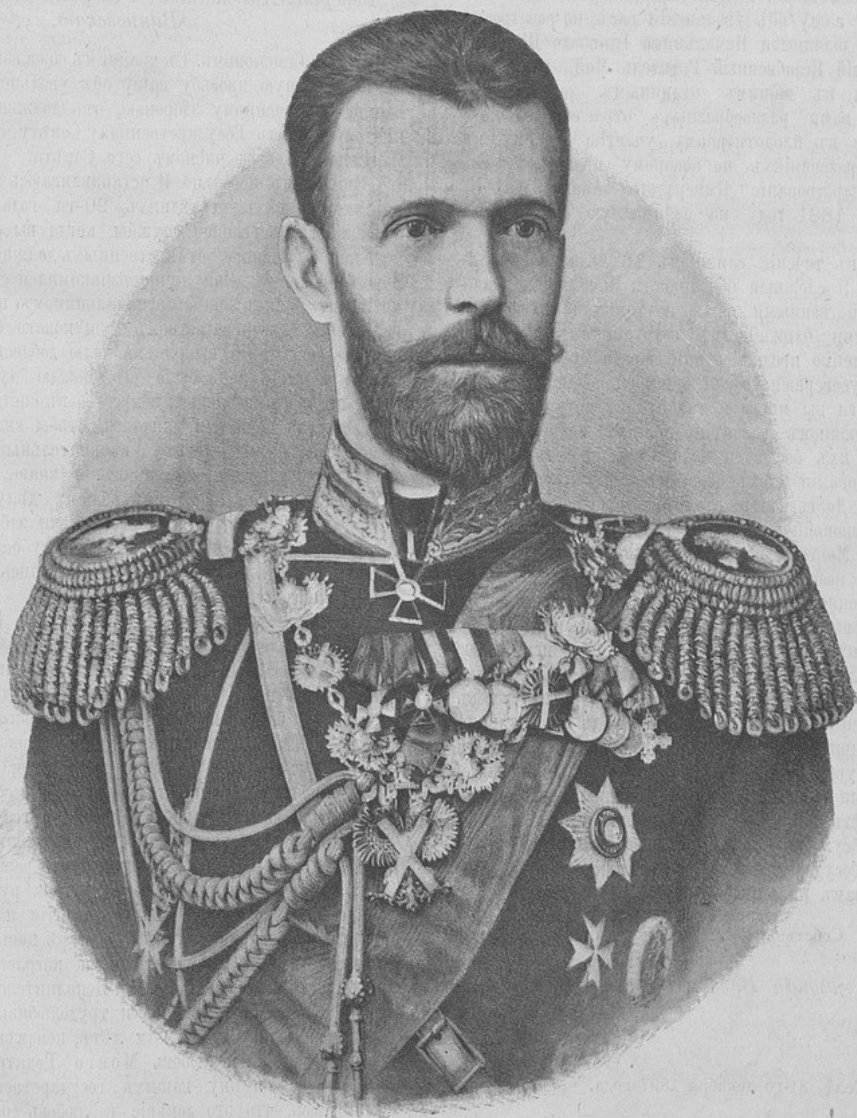
Его Императорское Высочество Великій Князь СЕРГІЙ АЛЕКСАНДРОВИЧЪ, Московскій генераль-губернаторъ и командующій войсками Московскаго военнаго округа.

СОДЕРЖАНІЕ: Портретъ Великаго князя Сергія Александровича. — Высочайшія повелѣнія. — Разныя распоряженія. — Изъ военнаго быта. Я. Гребенщиковъ. — Опредѣленія экономическихъ офицерскихъ обществъ. М. К. — Памятникъ русскимъ въ Хивѣ. К. М. — Объявленіе приговоровъ суда въ приказахъ. С. Л-въ. — Возрожденіе русской кровной лошади. В. Сухомлиновъ. — Каджиярское дѣло 7-го января 1878 г. Подесаулъ Щаповской. — Бивачное кольцо (съ рисункомъ). Д. Батурикъ и Н. Сухотинъ. — На большихъ Бѣлостокскихъ маневрахъ. — И. — Новыя изданія: Обзоръ Закаспійской области. А. З-въ. — Краткая систематическая грамматика французскаго языка. В. Кантъ. П.