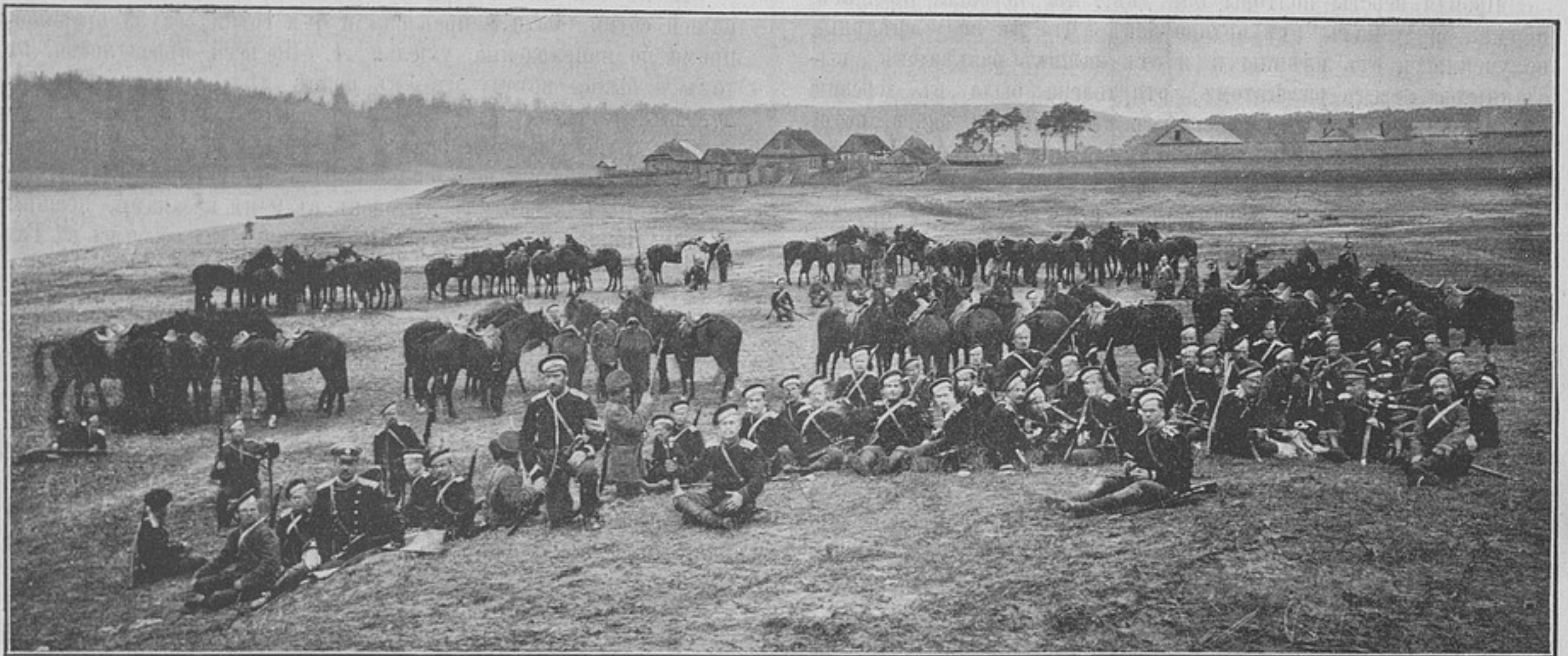
5-й эскадронъ 8-го Смоленскаго драгунскаго Императора Александра III полка на привалѣ (къ статьѣ «Бивачное кольцо»).

Когда лошади установились и стоятъ вполне смирно, дневальный выходитъ изъ круга и наблюдаетъ за ними со стороны. Кольца по 2 на взводъ берутся у ефрейторовъ притроченными къ шинели. Въ эскадронѣ 10 колець, изъ нихъ 8 для взводовъ и 2 считаются запасными. За неимѣніемъ кольца можно замѣнить оное стремянемъ, снятымъ съ путлица. При уборкѣ лошадей, когда сѣдлаютъ, когда надѣты торбы или за-