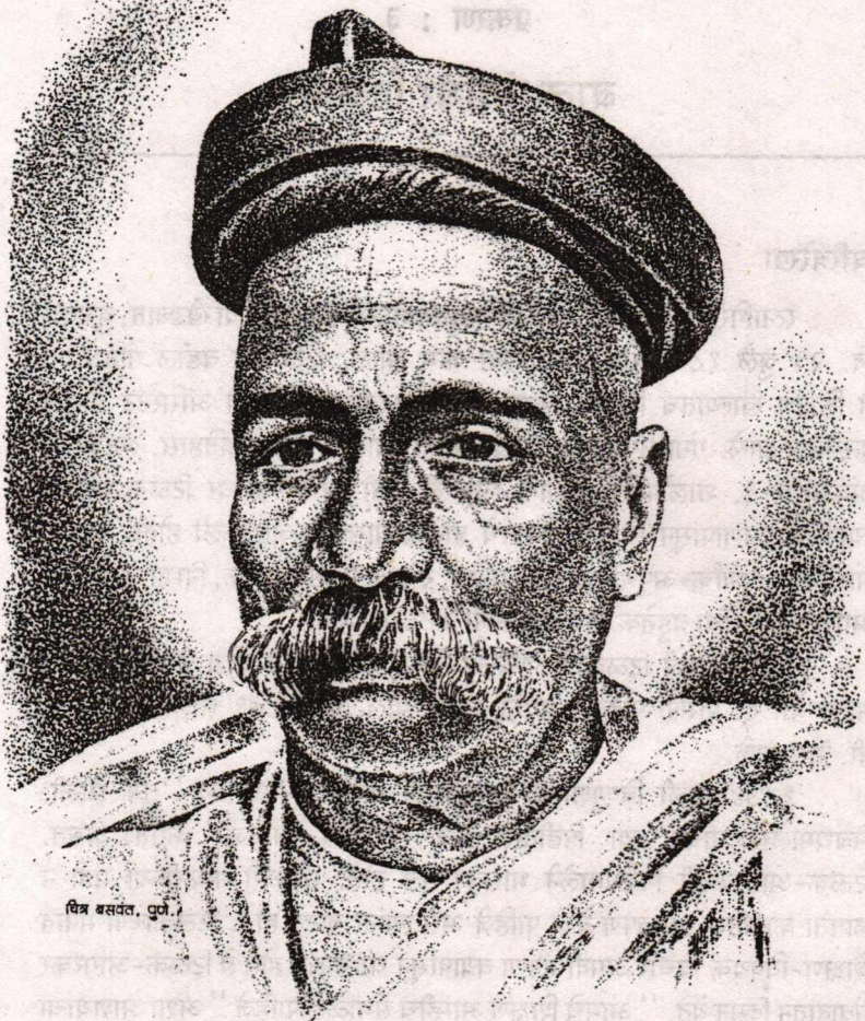
चित्र बसवत, पुणे