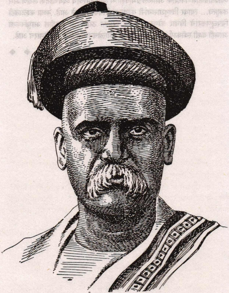
गोपाळ गणेश आगरकर

विशिष्ट शिक्षणविशारद व विभागाध्यक्ष व प्रमुखकाठी प्रत्येकीकडे केलेले व आचार्य वर्य हातांनी प्रकाशित वर्यकाळीक-अन्वय व विचार विचार्य वर्य व्यापारीक-गोप्य वर्यही वर्यकाळीक विर्य विचार्य वर्य विचार्य वर्य वर्य वर्य वर्य वर्यकाळीक विचार्य वर्य वर्य वर्य वर्य वर्य वर्य वर्य वर्य वर्य वर्य वर्य वर्य वर्यकाळीक विचार्य वर्य वर्य वर्य वर्य वर्य वर्य वर्य वर्य वर्य वर्य वर्य वर्य वर्यकाळीक विचार्य वर्य वर्य वर्य वर्य वर्य वर्य वर्य वर्य वर्य वर्य वर्य वर्य वर्यकाळीक विचार्य वर्य वर्य वर्य वर्य वर्य वर्य वर्य वर्य वर्य वर्य वर्य वर्य वर्यकाळीक विचार्य वर्य वर्य वर्य वर्य वर्य वर्य वर्य वर्य वर्य वर्य वर्य वर्य वर्यकाळीक विचार्य वर्य वर्य वर्य वर्य वर्य वर्य वर्य वर्य वर्य वर्य वर्य वर्य