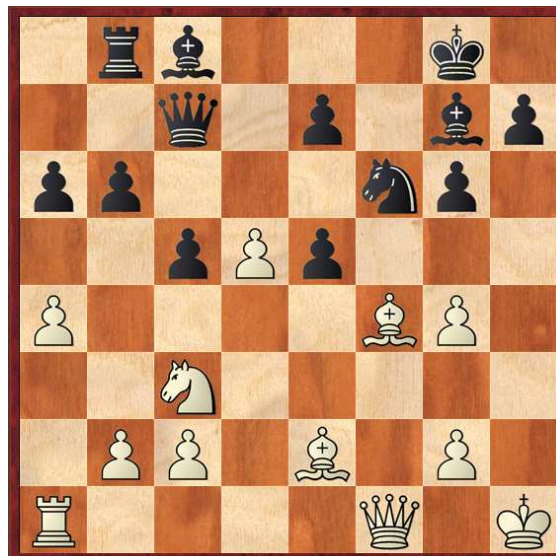
Diagrama 2, Posición después de 18...e5♣

12.e5! dxe5 13.fxe5 Cg4 [13...Cxe5? 14.Cxe5 Dxe5 15.Af4+-] 14.e6? Esto pierde de manera lineal [14.d6! exd6 15.Cd5 Dd8 16.Ag5! f6 17.e6+- El negro pierde material inexorablemente] 14...fxe6 15.h3 Txf3! 16.hxg4 Txf1+ 17.Dxf1 Cf6? [17...Dg3!-+ Con la amenaza de Dh4-Ae5 ó Ad4] 18.Af4?! [18.dxe6!± Seguido de Af4] 18...e5♣ (0-1)