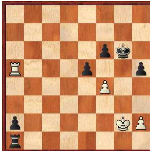
Diagrama 4, Posición final

29.cxd4 Tc2+ 30.Rg3 Txb2 31.Tc1 Tb4 32.Tc8+ [32.Tc6 Rh7+] 32...Rh7 33.Tb8 Rg6 34.Tb7 Txd4 35.Txb6 Txa4 36.Tb7 a5 37.Ta7 Ta1 38.Rf3 a4 39.Rg3 a3 40.Rf3 a2 41.Rg2 f6 42.gxf6 gxf6 43.Ta5 e5 (0-1)