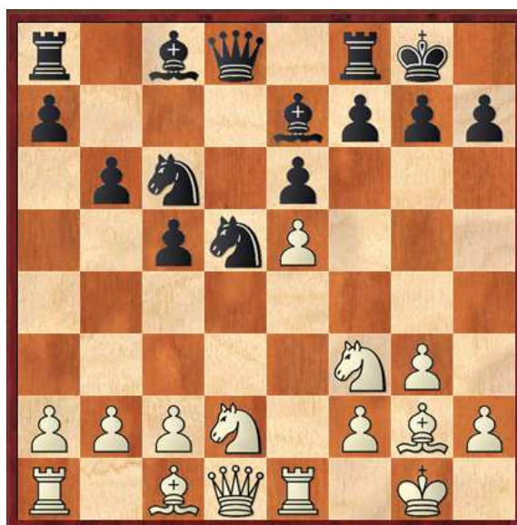
Diagrama 1, Posición después de 10...b6?! Una movida que ha ocasionado más de un problema a las negras

1.Cf3 d5 2.g3 c5 3.Ag2 Cf6 4.0-0 e6 5.d3 Ae7 6.Cbd2 0-0 7.e4 dxe4 8.dxe4 Cc6 9.e5! Como el negro está enrocado corto el avance de e5 cobra mayor fuerza para realizar el ataque en el flanco de rey 9...Cd5 [9...Cg4?! 10.De2 Dc7 11.Cc4±] 10.Te1 b6?! Generalmente el b6 será un error cuando el rey negro está enrocado corto [10...Dc7 11.De2 Td8 12.c3=]