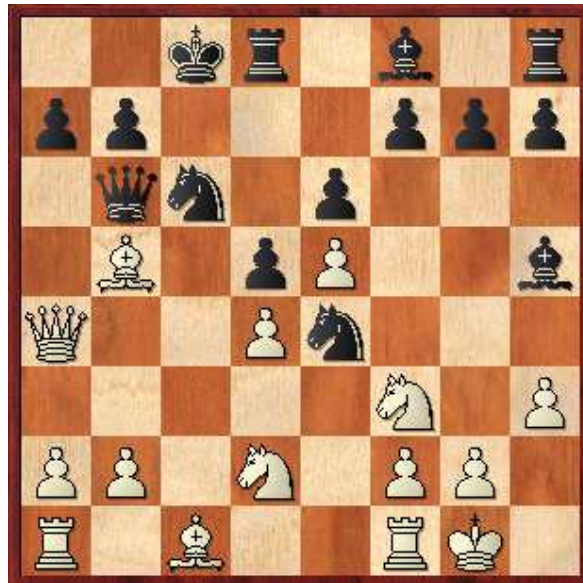
Diagrama 1, Posición después de 12...0-0-0?

13.Axc6?! [13.Cxe4! dxe4 14.Ae3!! exf3 15.Tfc1+- La presión sobre la columna c y la buena disposición de las piezas blancas dejan a las negras en una posición perdida] 13...bxc6 14.b3?? Generalmente se utiliza el tema del tiempo como excusa de movidas como ésta ¿se puede estar apremiado por el tiempo en la movida número 14? , lo cierto es que la presente movida demuestra que el blanco simplemente no calculó [14.Te1!±] 14...Cc3! Captura la dama (0-1)