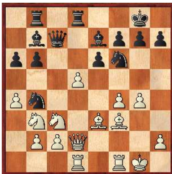
Diagrama 2, Posición después de 16...Cb4!♣

12.Cb3 Tb8 13.a4 b6N [RR 13...b5 14.axb5 axb5 15.Cd4 b4 16.Cce2 Ca5 17.Txa5 Dxa5 18.Cc6 Dc7 19.Cxd8 Dxd8 20.Ta1 Ab7 21.Aa7 Ta8 22.Dxb4 Dc7 23.Dc3 Ad8 24.e5 Axf3 25.Dxc7 Axc7 26.gxf3 dxe5 27.fxe5 Ab6+ 28.Rg2 Schippers,P–Drozdowski,K/Twente 2007/EXT 2008/0-1] 14.Tad1 Ab7 15.g4?! Debilitando peligrosamente el flanco de rey 15...d5! 16.exd5 Cb4!♣ Complemento del d5.