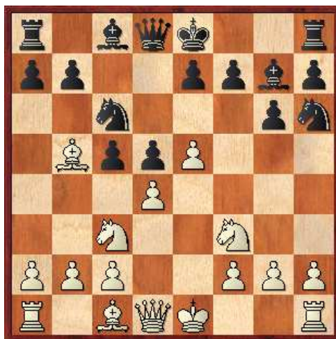
Diagrama 1, Posicion despues de 6...Ch6

1.e4 g6 2.d4 Ag7 3.Cc3 d5 4.e5 [RR 4.exd5 Cf6 5.h4 Cxd5 6.h5 c5 7.Cxd5 Dxd5 8.dxc5 Dxd1+ 9.Rxd1 gxf3 10.c3 Cc6 11.Ae2 Ag4 12.f3 0-0-0+ 13.Re1 Af5 14.Txh5 Ag6 15.Th1 e5 16.Ch3 e4 17.Cf4 exf3 18.gxf3 The8 Balashov,Y-Bezgodov,A/Kazan 2006/CBM 112 ext/0-1 (31)] 4...c5 5.Cf3N [RR 5.dxc5 d4 6.Ab5+ (RR 6.Ce4 Axe5 7.Cf3 Ag7 8.Ag5 Da5+ 9.Ad2 Dc7 10.Ab5+ Ad7 11.De2 Axb5 12.Dxb5+ Cc6 13.De2 0-0-0 14.Tb1 h6 15.b4 Cf6 16.b5 Cxe4 17.Dxe4 Ce5 18.b6 axb6 19.cxb6 Cxf3+ 20.Dxf3 De5+ Rigopoulos Tsigkos,A-Papadimitriou,A/Athens 2008/CBM 125 Extra/0-1 (41)) 6...Cc6 7.Axc6+ bxc6 8.Cce2 Axe5 9.Cf3 Ag7 10.Cfxd4 Da5+ 11.c3 Dxc5 12.0-0 Cf6 13.Ae3 Cg4 14.Ce6 Da5 15.Cxg7+ Rf8 16.h3 Cxe3 17.fxe3 Rxe7 18.Dd4+ e5 19.Dd6 Ae6 San Martin Alvarez,A-Montero Martinez,C/Santiago de Chile 2003/EXT 2004/0-1 (40); RR 5.f4 cxd4 6.Dxd4 Cc6 7.Df2 e6 8.Cb5 Af8 9.Ae3 Ch6 10.Ae2 Cf5 11.Ac5 Axc5 12.Dxc5 a6 13.g4 axb5 14.gxf5 gxf5 15.Axb5 Ad7 16.Ad3 d4 17.Cf3 Tg8 18.h3 Ta5 19.Dd6 Db6 Pirrot,D-Schatz,C/Bad Wiessee 2007/CBM 121 Extra/1-0 (32)] 5...Cc6 [5...c4!?!; 5...Ag4!?! 6.dxc5 Cc6 7.Ae2 Axf3 8.Axf3 e6↗] 6.Ab5 [6.dxc5 Ag4 7.Dxd5 Dxd5 8.Cxd5 0-0-0 9.c4 Axf3 10.gxf3 Cxe5↗] 6...Ch6 [6...a6!?! 7.Axc6+ bxc6 8.dxc5 Ag4↗; 6...cxd4 7.Cxd4 Ad7 8.f4 Ch6↗]