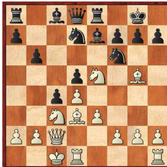
Diagrama 3, Posición después de 11...c4??

10.Cf3 [10.Axh7+?! Cxh7 11.Axe7 Dxe7 (11...Txe7 12.Cxd5 Te8?) 12.Cxd5 Dd8 13.Dxc7 Chf6?] 10...c5 [10...Ab7 11.Ce5!→ Con la idea de f4 y g4] 11.Ce5 [11.Ab5!? Ab7 12.dxc5 bxc5 13.Df5 g6 14.Dh3↑ La presión del blanco pone a las negras en aprietos] 11...c4??