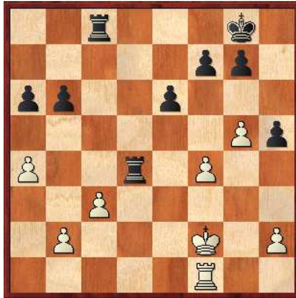
Diagrama 3, Posición después de 28...Txd4!! Las negras devuelven la calidad para entrar a un final ganado

29.cxd4 Tc2+ 30.Rg3 Txb2 31.Tc1 Tb4 32.Tc8+ [32.Tc6 Rh7+] 32...Rh7 33.Tb8 Rg6 34.Tb7 Txd4 35.Txb6 Txa4 36.Tb7 a5 37.Ta7 Ta1 38.Rf3 a4 39.Rg3 a3 40.Rf3 a2 41.Rg2 f6 42.gxf6 gxf6 43.Ta5 e5 (0-1)