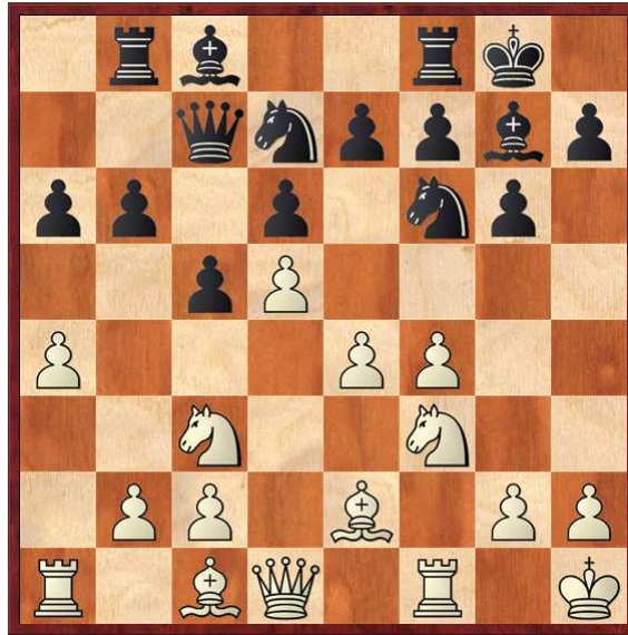
Diagrama 1, Posición después de 11...Tb8?

12.e5! dxe5 13.fxe5 Cg4 [13...Cxe5? 14.Cxe5 Dxe5 15.Af4+-] 14.e6? Esto pierde de manera lineal [14.d6! exd6 15.Cd5 Dd8 16.Ag5! f6 17.e6+- El negro pierde material inexorablemente] 14...fxe6 15.h3 Txf3! 16.hxg4 Txf1+ 17.Dxf1 Cf6? [17...Dg3!-+ Con la amenaza de Dh4-Ae5 ó Ad4] 18.Af4?! [18.dxe6!± Seguido de Af4] 18...e5♣ (0-1)