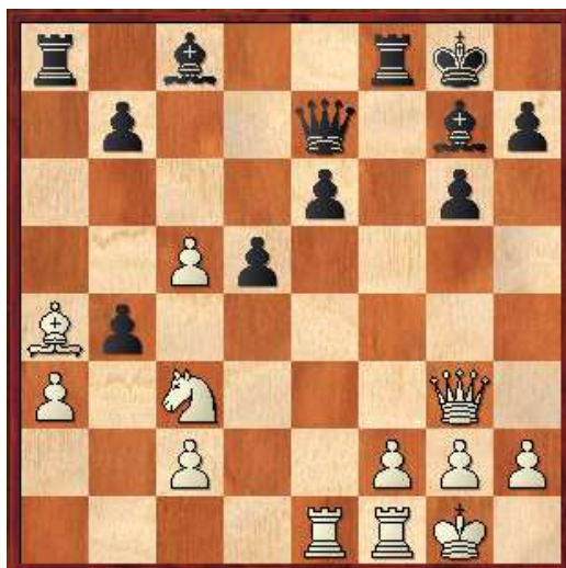
Diagrama 2, Posición final