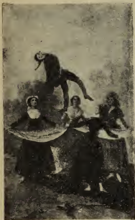
UNA VIEJA.—De hinojos, los bra- zos en cruz, con gesto que surge de

de la plegaria se extienden por cima de todas las cabezas.)