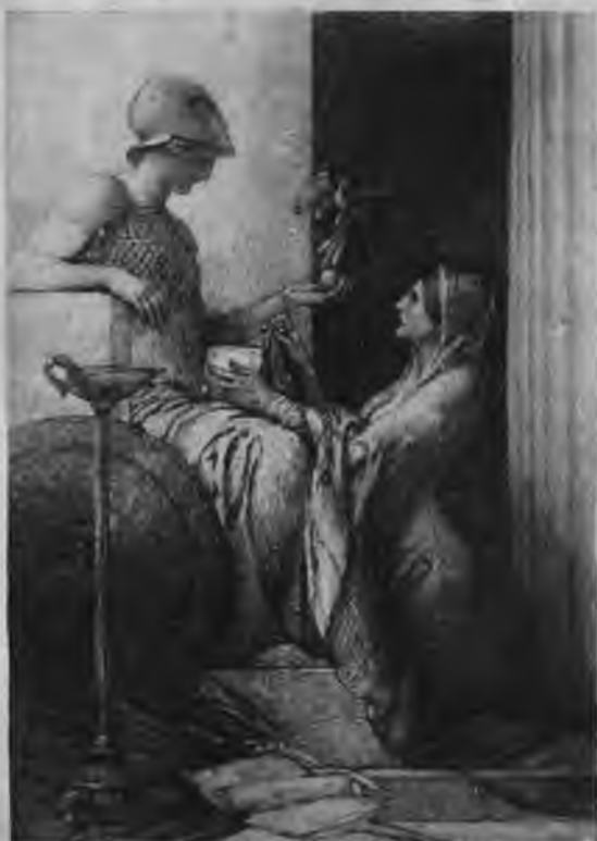
LELAND • STANFORD • JUNIOR • UNIVERSITY