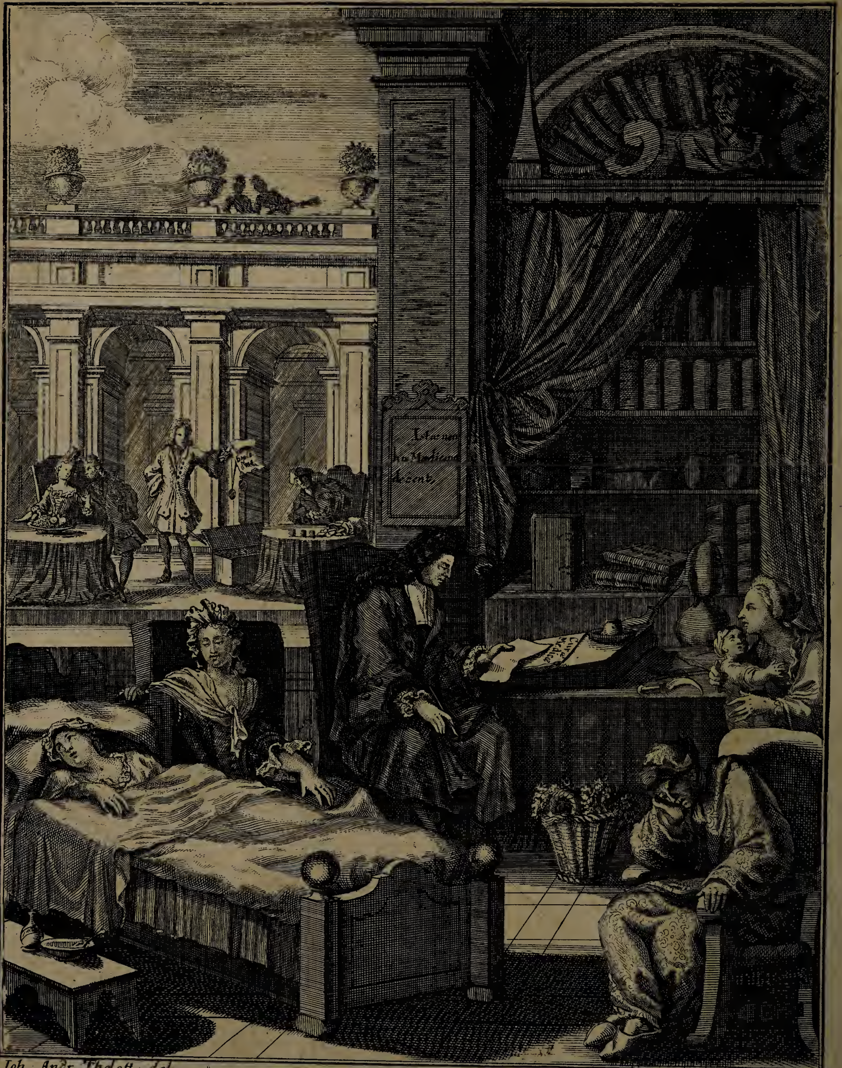
Joh. Andr. Theloft. del.