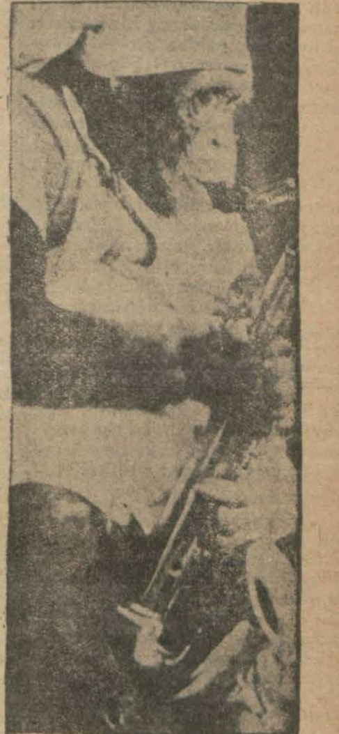
Saksfon çalan şimpanze

Sinemada iş görmüş hayvanlar arasında Rintintin ismin