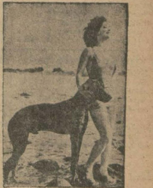
Clara Bow ve köpeği