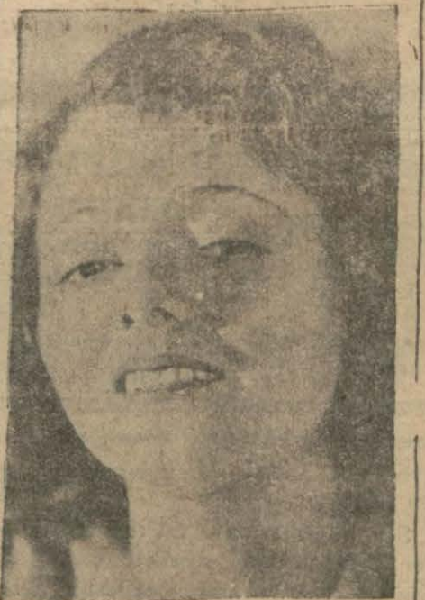
Bir Amerikan gazetesinin açtığı müsabakada sinema kraliçesi intihap edilen Janet Gaynor.

Şimdiki karısı kendisinden yaşlıdır ve son zamanlara kadar tiyatroya oynuyordu. Fakat kocası sinema artisti olarak çok para kazandığı için, sahneyi terketmiştir. Belki bir gün de sinemaya gelir.