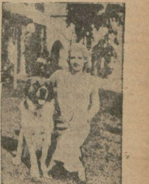
Anita Page ve köpeği Elmar

deki köpeği bilmiyen yoktur. Fakat Rintintin şimdi ihtiyarladığı için tekaüde çıkarılmıştır. Bu köpeğin kazandığı parayı, birçok değme artistler kazanamamışlardır.