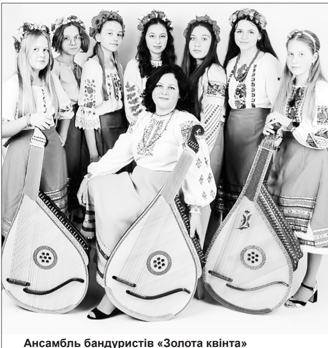
Ансамбль бандуристів «Золота квінта»