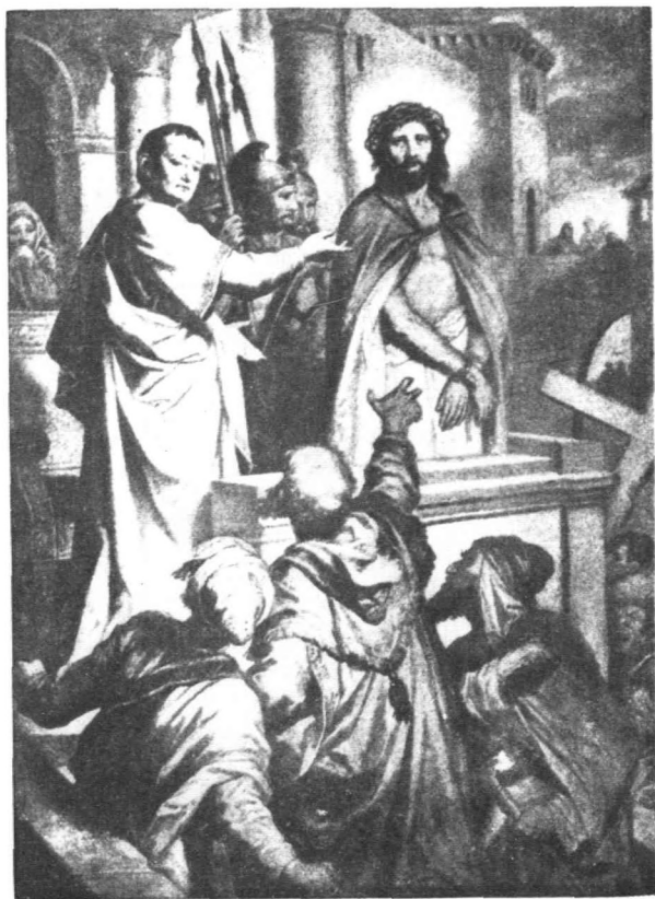
耶穌在彼拉多前受審