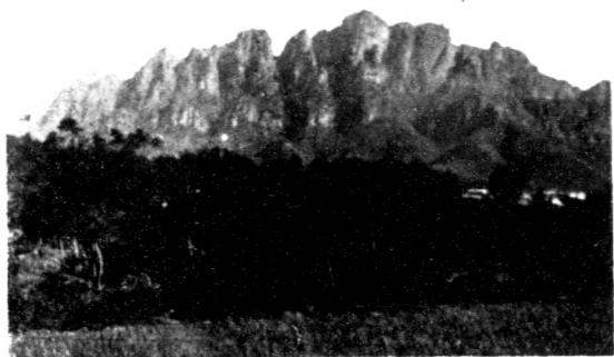
五 老 峯