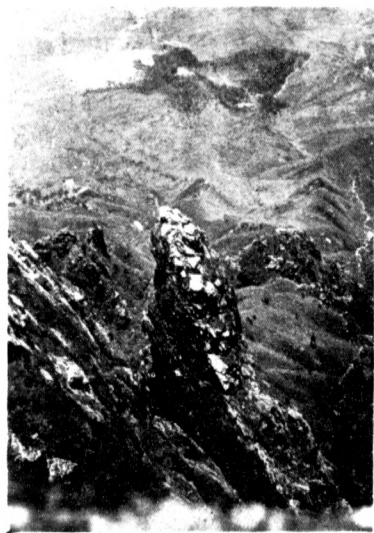
五老峰之前獅子峯