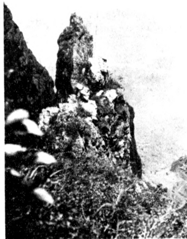
五 老 峯 之 奇 巖