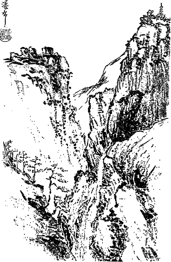
石 門 瀑 布