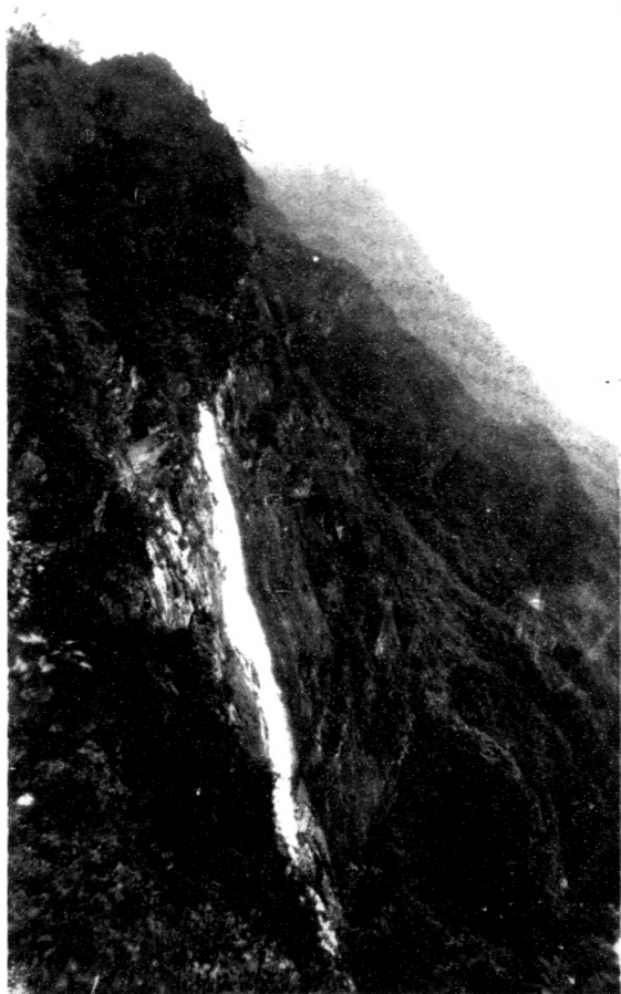
布 瀑 先 開