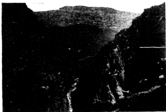
九 壘 屏