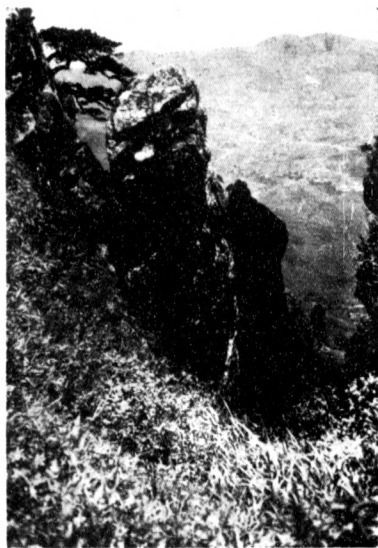
五 老 峯