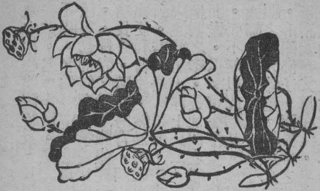
此花現於木梢回頭之花下一葉二蓮斗二菡萏三