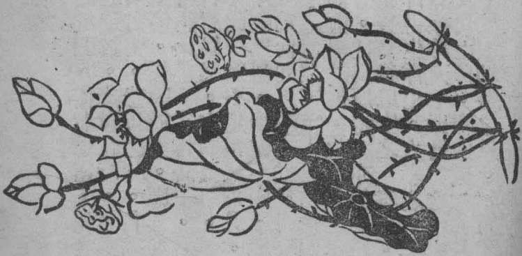
此花現於灶前二花二葉二蓮斗二菡萏五