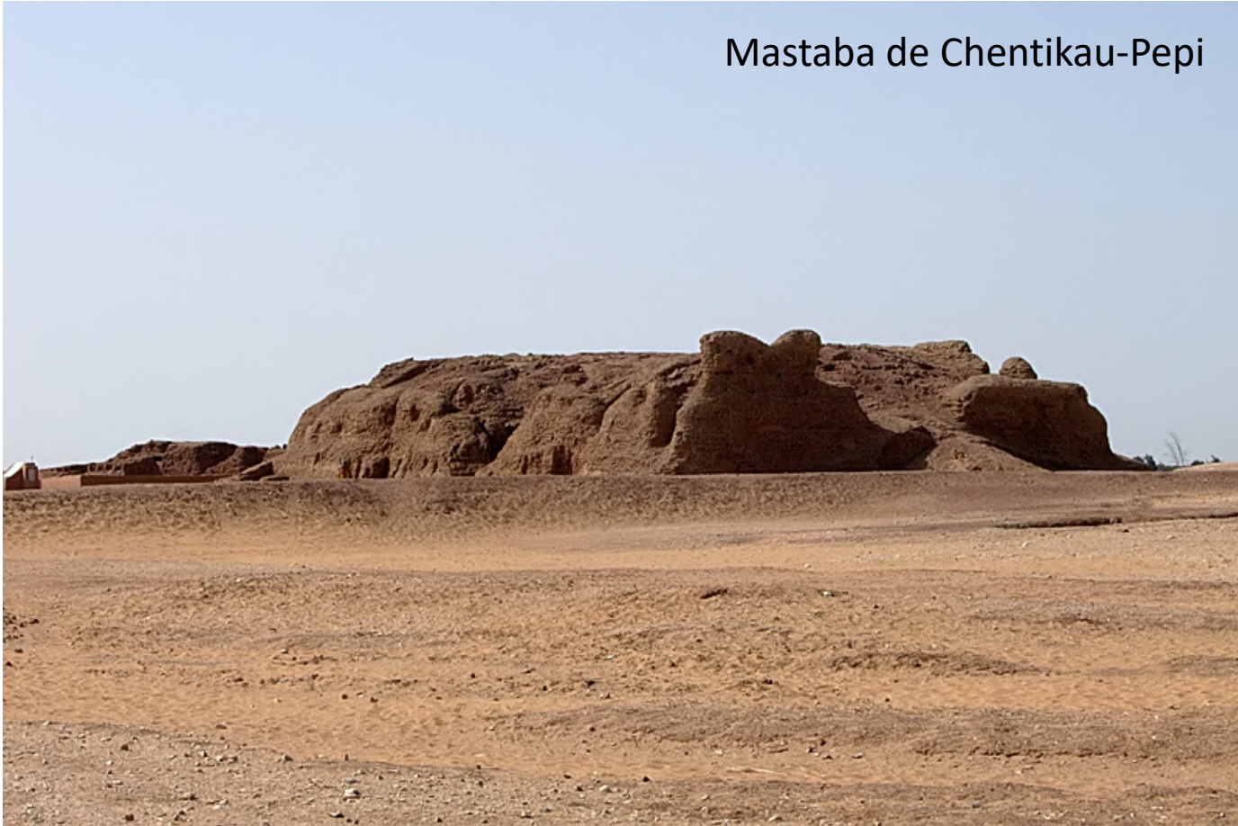
Mastaba de Chentikau-Pepi