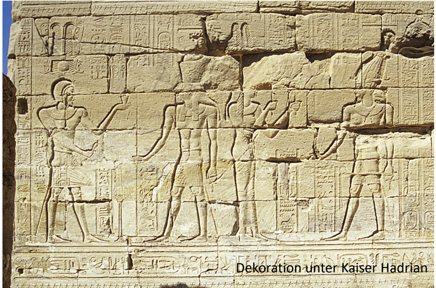
Dekoration unter Kaiser Hadrian