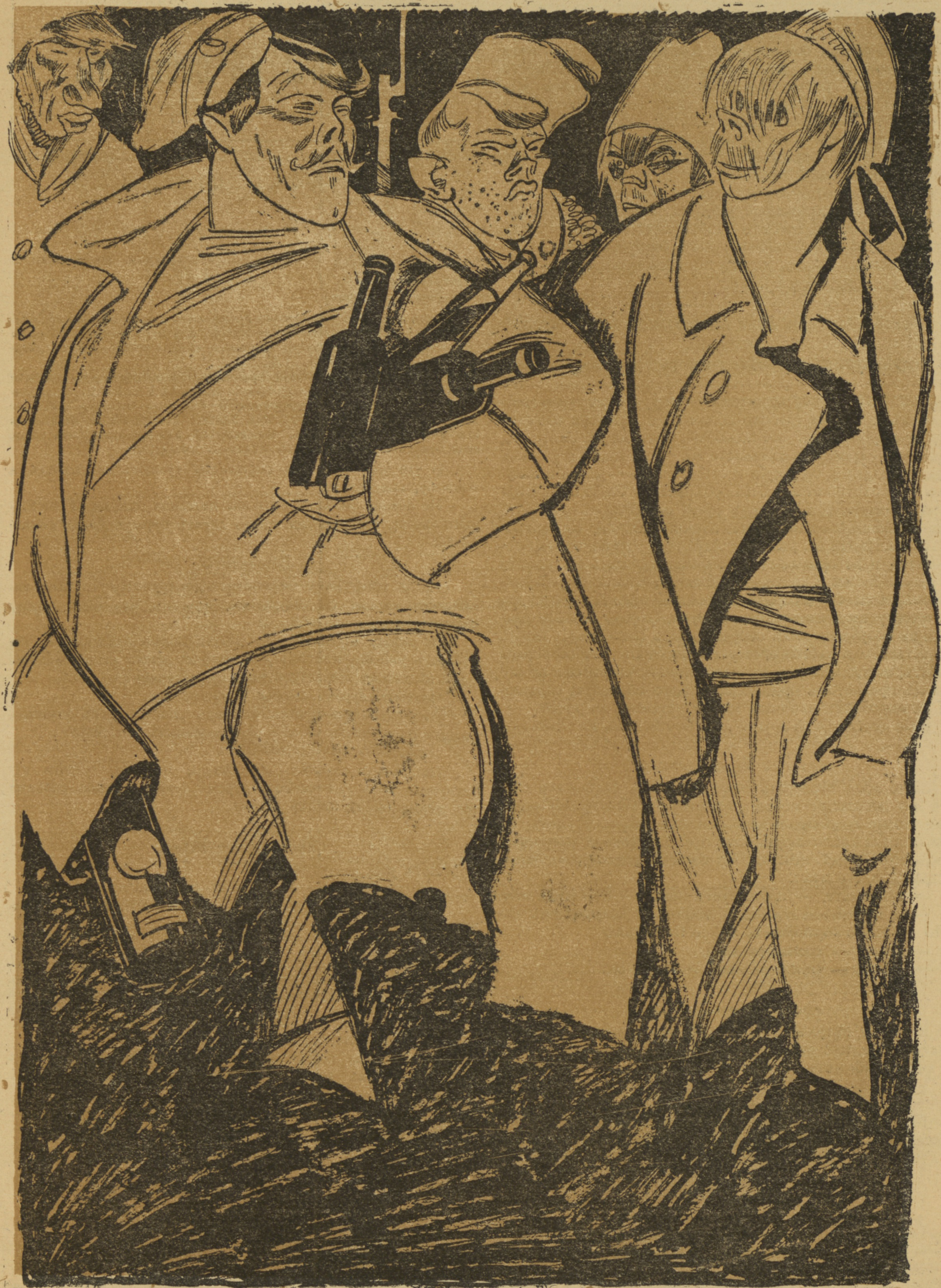
ПОБЪДИТЕЛИ, КОТОРЫХЪ НЕ СУДЯТЪ.