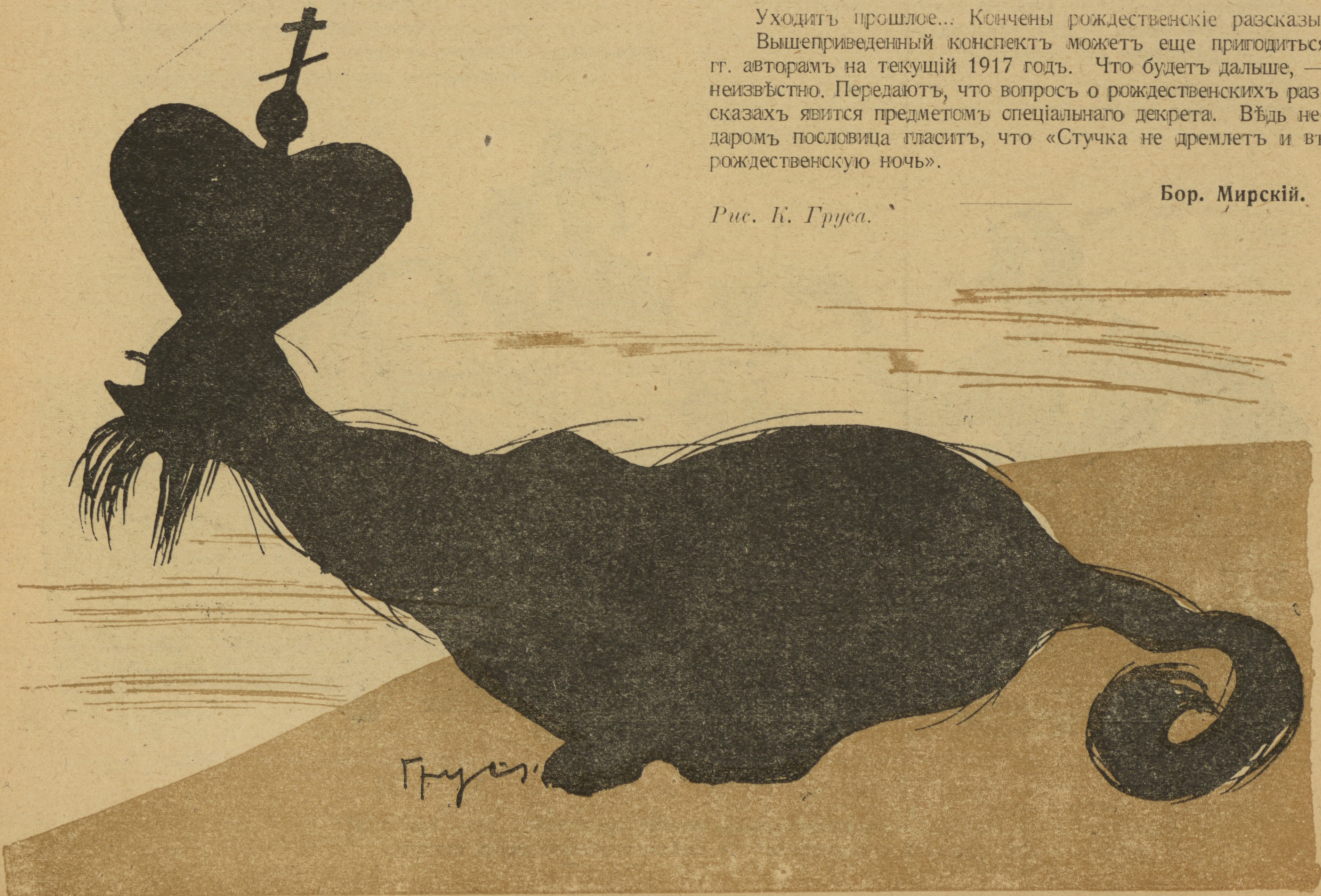
Рис. К. Грусса.