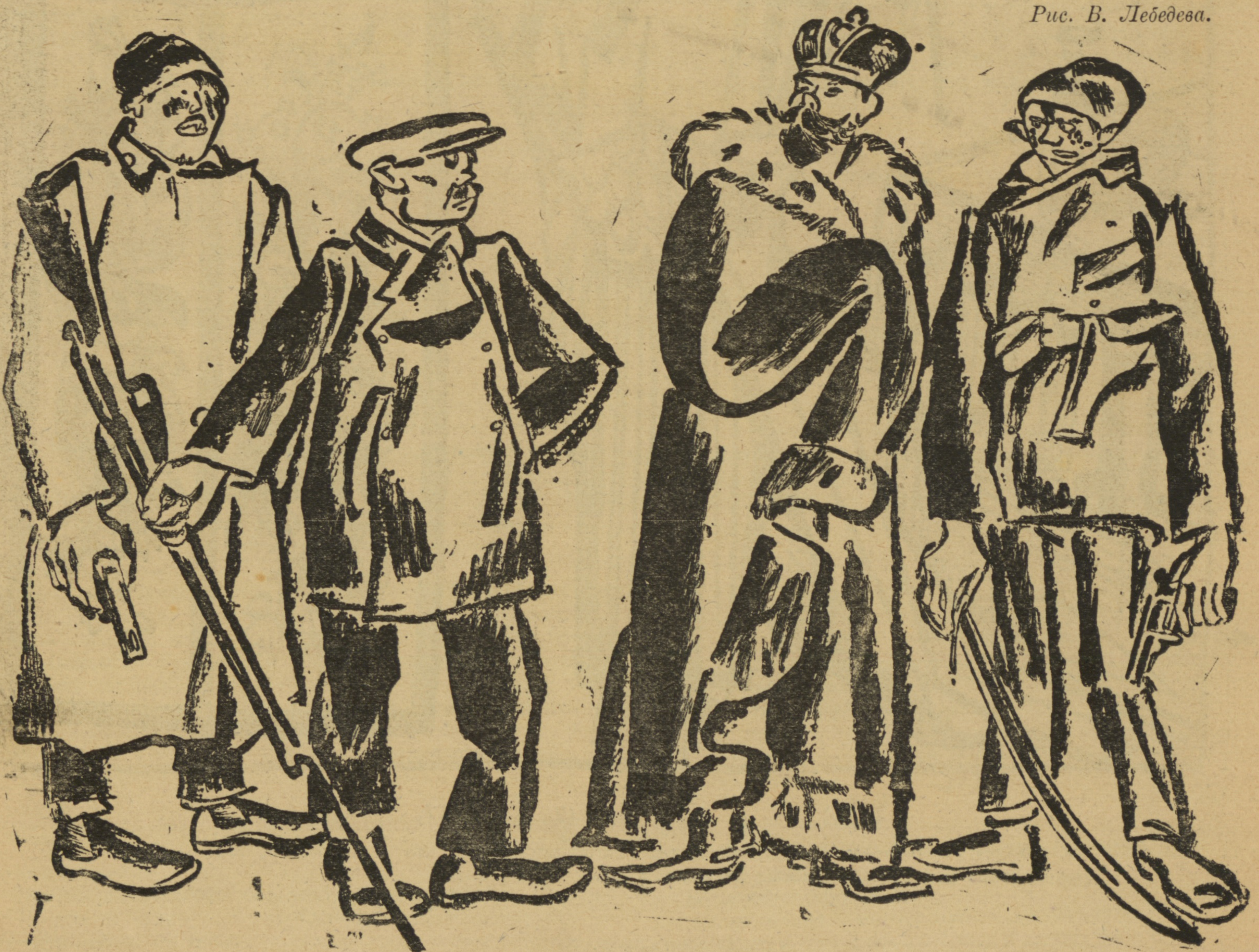
Рис. В. Лебедева.