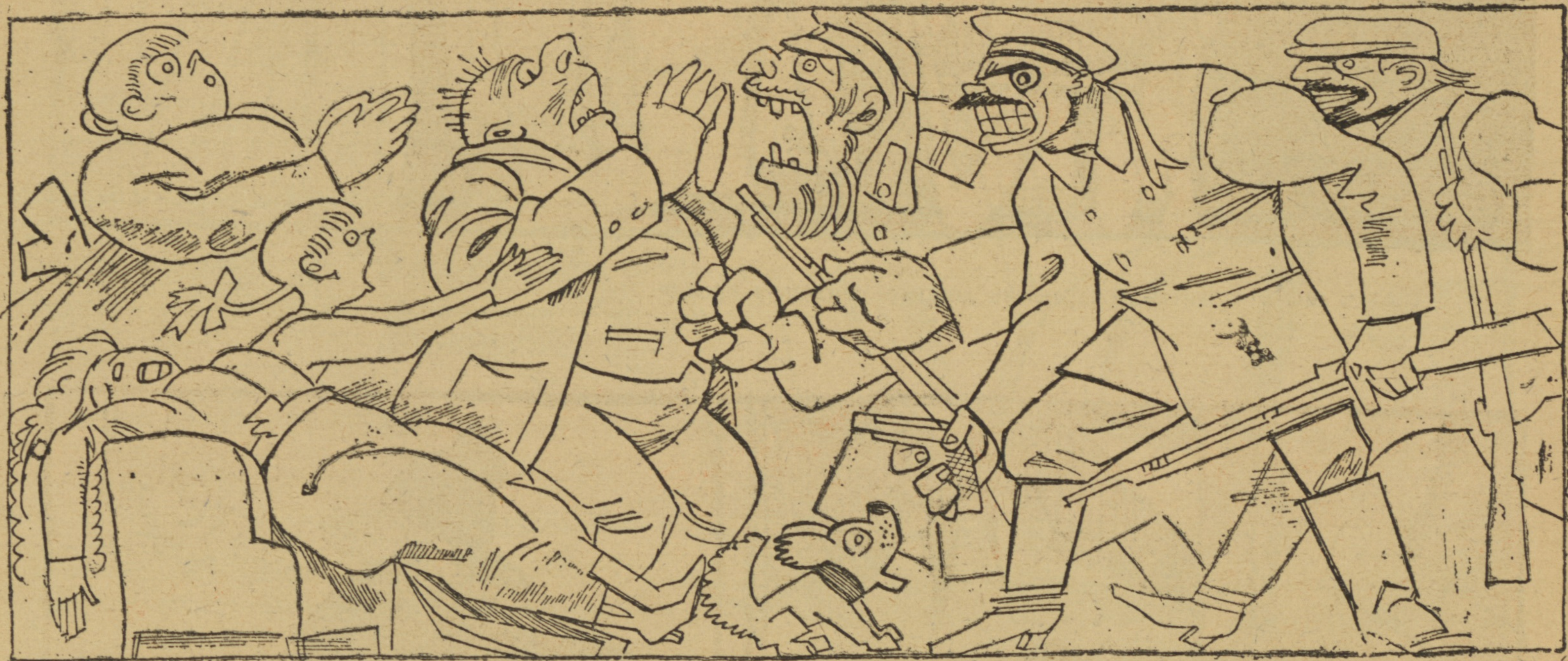
Октябрь 1917 г. Бель-этажъ.