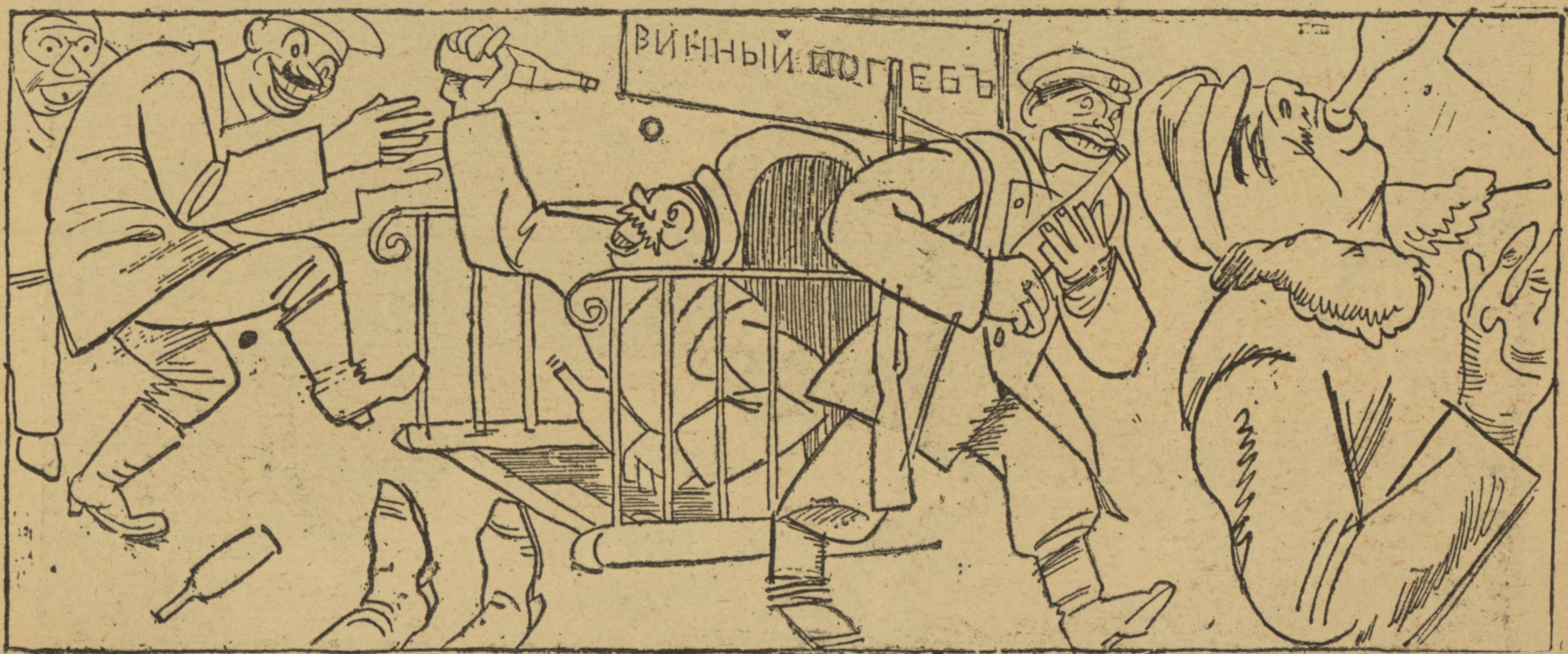
Декабрь 1917 г. Погребъ.