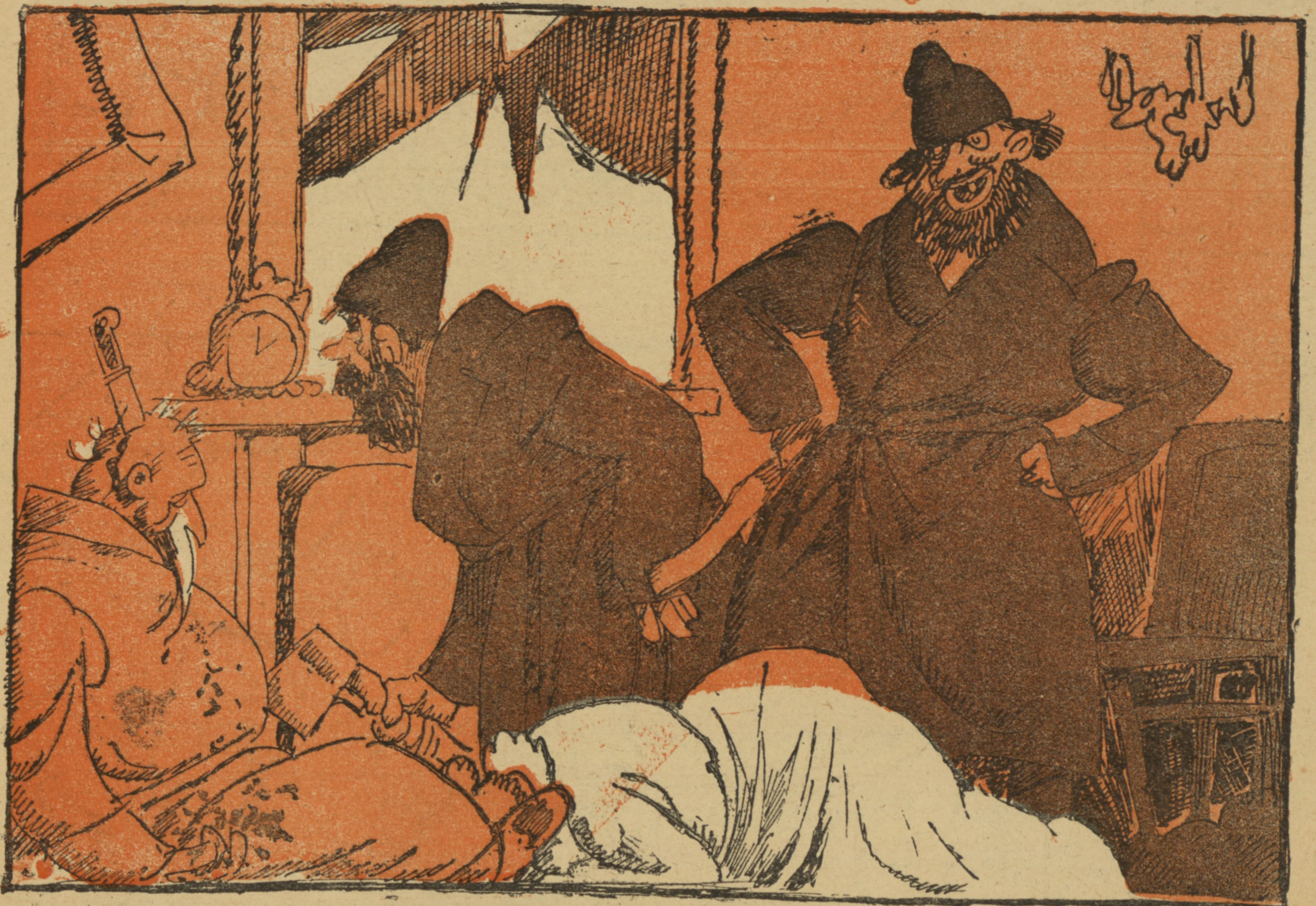
И какъ милые мужички поздравляютъ добраго помѣщика теперь...