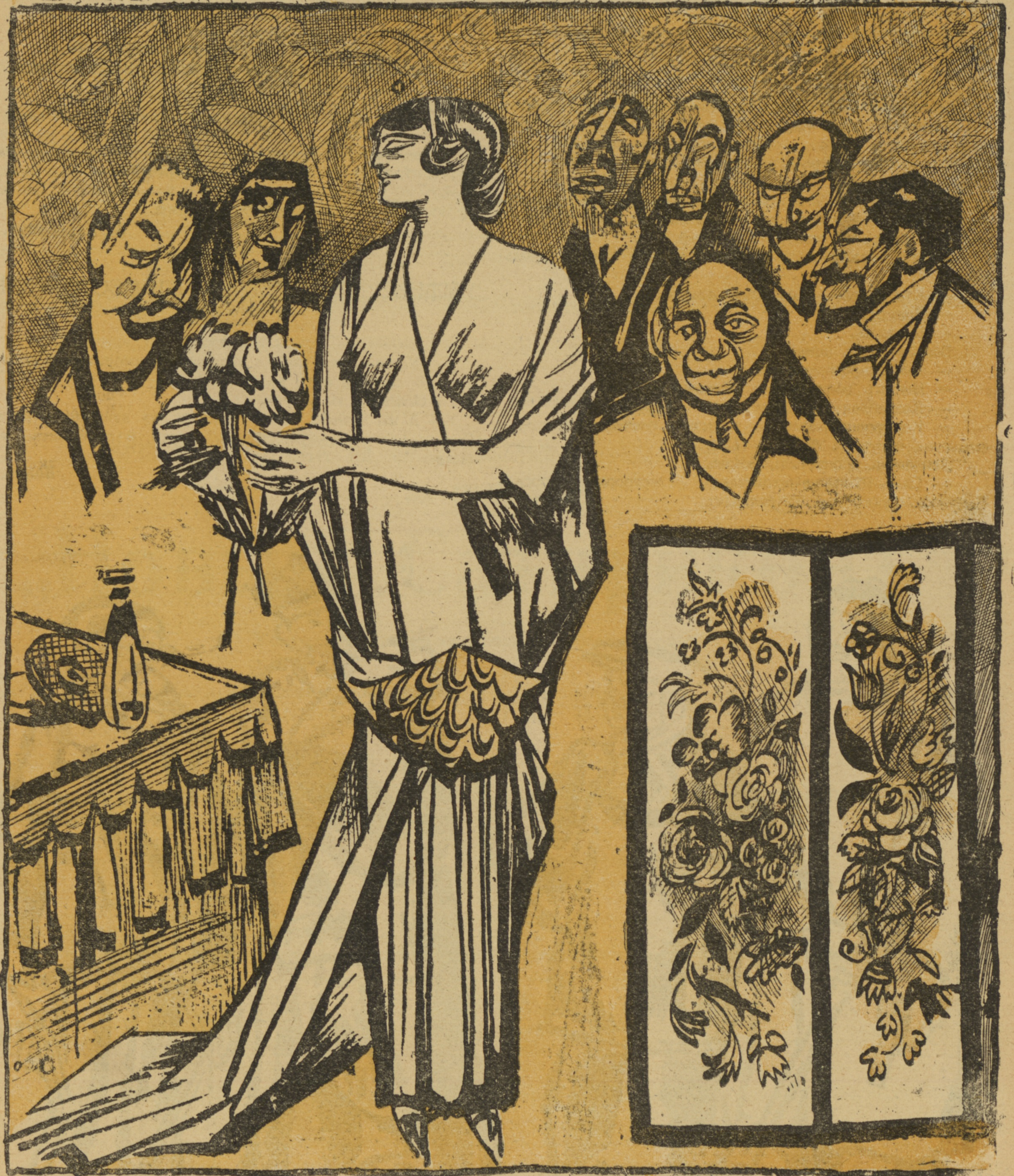
Рис. А. Гадакова.