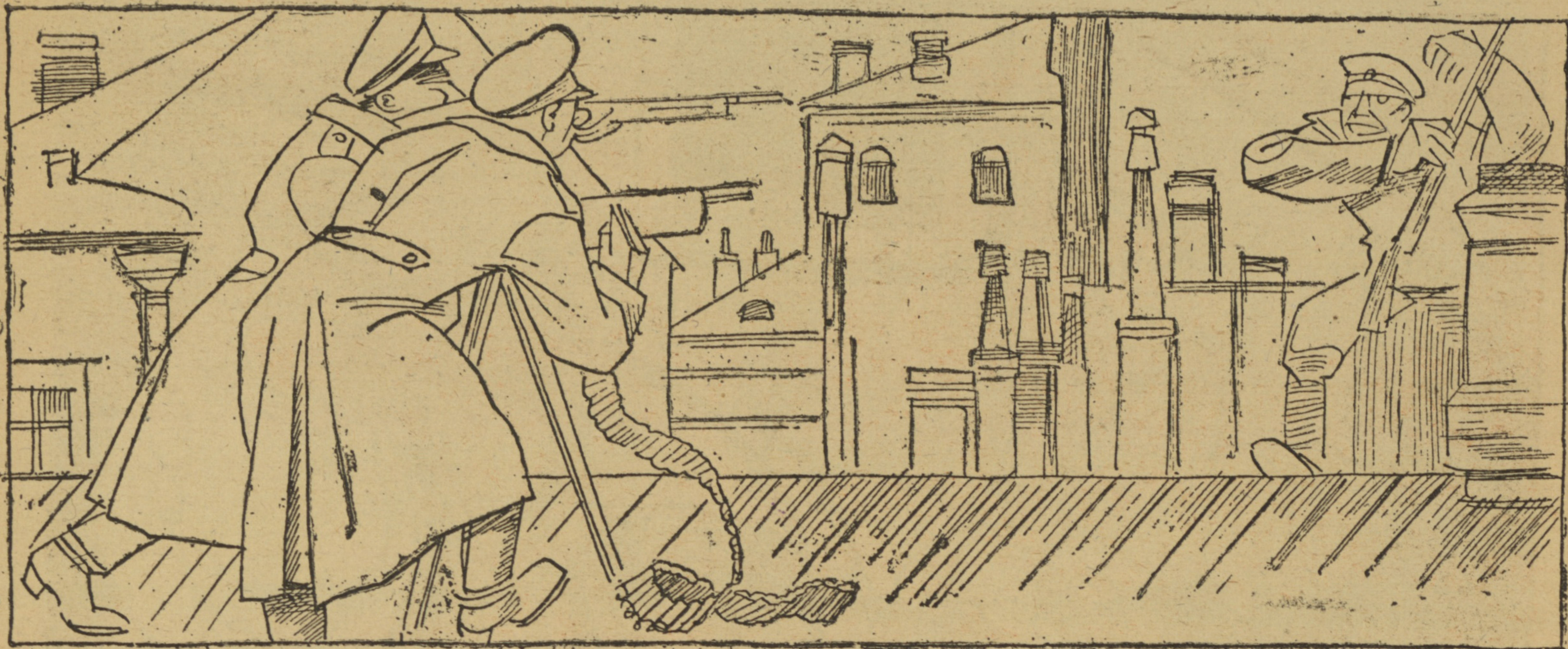
Февраль 1917 г. Крыша.