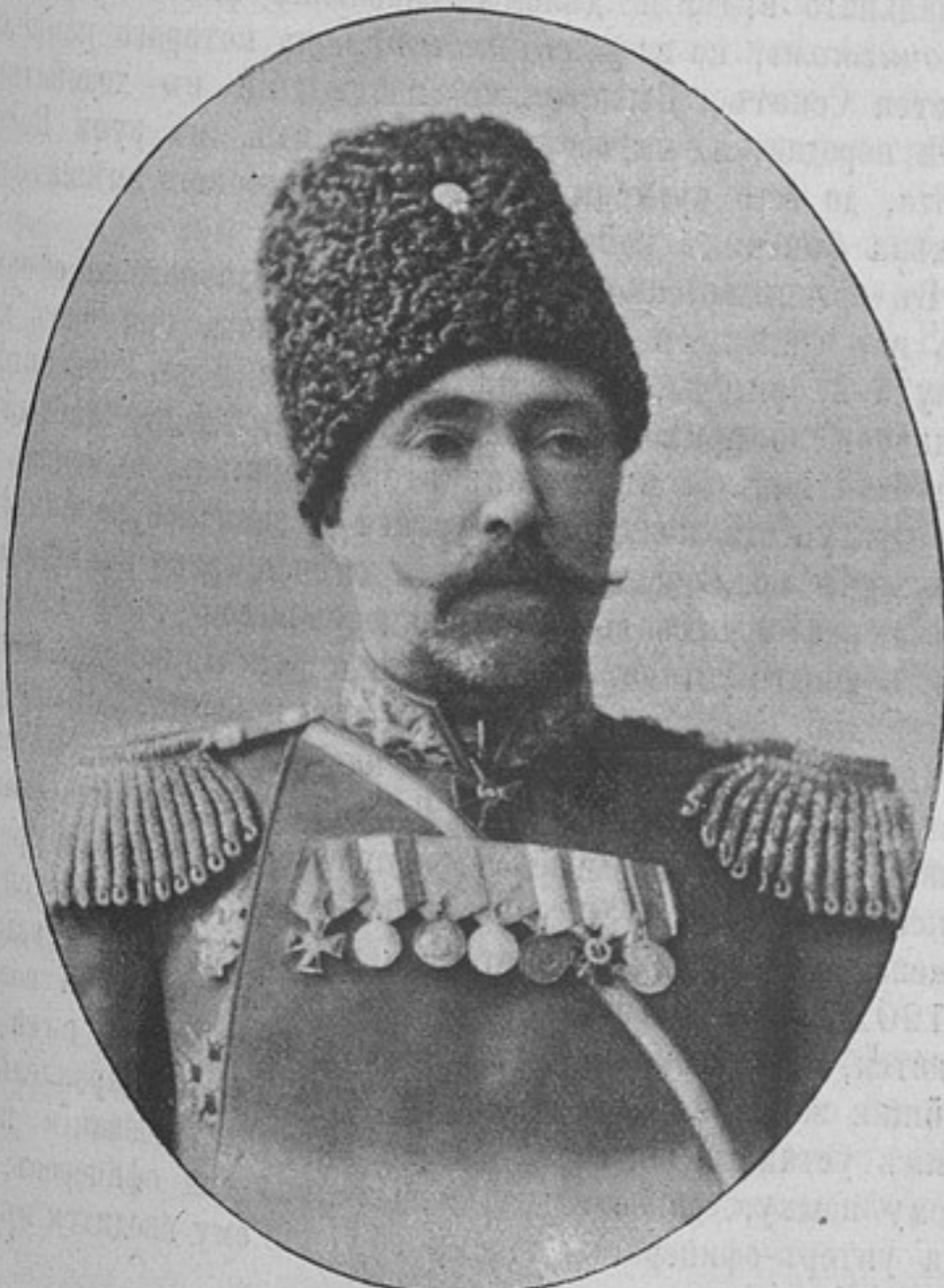
Начальникъ 3-й Восточно-Сибирской стрѣлковой бригады, генераль-маіоръ Анатолій Михайловичъ СТЕССЕЛЬ. Родился въ 1848 г. По окончаніи курса въ 1 военномъ Пав-

ловскомъ училищѣ произведенъ 1866 г. въ подпоручики во 2-й гренадерскій Ростовскій полкъ. Въ 1876 г. былъ командированъ въ полевой штабъ дѣйствующей арміи въ г. Кишиневъ и вошелъ въ ряды Болгарскаго ополченія, съ которыми и участвовалъ въ кампаніи 1877—1878 гг. Командуя ротой въ 3-й дружинѣ, за военныя отличія награжденъ чинами капитана, маіора и орденомъ Св. Станислава 2-й ст. съ мечами. Въ 1889 г. назначенъ командиромъ 5-го Восточно-Сибирскаго стрѣлковаго баталіона. Въ томъ же году произведенъ въ полковники. Съ 1890 по 1892 годъ командовалъ 9 Восточно-Сибирскимъ стрѣлковымъ баталіономъ и затѣмъ состоялъ въ распоряженіи командующаго войсками Кіевскаго военнаго округа до 15 сентября того же года, когда былъ назначенъ командиромъ 9-го стрѣлковаго полка. Въ 1897 г. назначенъ командиромъ 16-го пѣх. Ладожскаго, а затѣмъ 44-го пѣх. Камчатскаго полка. Высочайшимъ приказомъ 26 января сего года назначенъ на настоящую должность съ производствомъ въ генераль-маіоры.