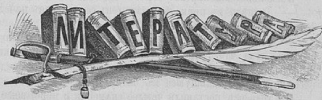
Въ пороховомъ дымѣ.