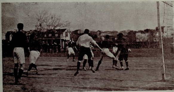
غلطه سرای والتون اردو مسابقه لری رسملرئدن