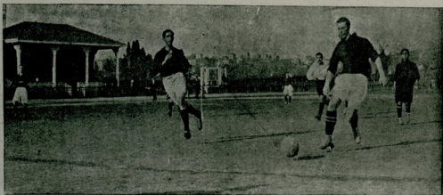
فوطو عمود بك

آقنجيلردن هيچ برينک اوگنده آراليق اولمايدنی کوزه جک اولورسه يامد افعلمی کندي اوزرينه جلب ايمک ايجون جناح لايچون برفرصت ، بر آراليق احضار ايمی و ياخود ايج آقنجيلردن استفاده يه چالشماليدر . بويه بر سرده اگ فائده لی و بریش ، طوي قطرائی اولاراق هر کردن جناح لک برينه و بر مکدر . بوکي و بریشلرده طوي آجیق آقنجينک ايج اولو طرفه و بر مک لازمدر؛ چونکه اولانجه سر عتيله گلکده اولدینی جهته اوروب طوي بکله يه مز . مع هذا ، جوق دفعه لر خاصمه يارديمچيلر بالخاصه بو او يونه انتظاراً قصدي اولاراق کري ده قاليرلر