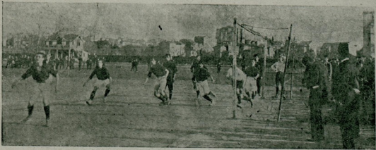
غلطه سرای ، التون اردو مسابقه سی رسملرندن

اگر بر اورته آقینجی وجود اعتباریه آغیر دکله مطلقاً درجه نه ایده قورناز اولمالیدر . کذا ، آقینجیلر کوزی پک جسور اولمالی عینی زمانده قرارلرنده ریاضی