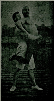
آباق طاقه فوطا دامان

اون برنجی ماده : مصارعلرک کیه چکری شیلر شونلردر : سیاه برمایو [ قانیله دون ] ، یوموشاق دری پوتین . وجودک بلدک یوقاری قسمی چپلاق بولوناجقدر . اون ایکنجی ماده : مصارعلر هیچ بروقت قوللرینه ووجودلرینه یاغ و بوکامائل قایجی رشئ سورونمیه چکلردر .