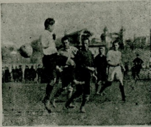
جمه برلیکی آباق طوپی ادمانلرندن فوطوعمو دک

-- افرنجی شاپک دردنجی چهارشنبه کونی پارسده (افل) قوله سنده بر آلت سقوط (پاراشوت) تجربیه سی اجرا ایدلشد. شمسه شکلنده اعمال اولنان اشبو آلتک آشانی قسمته ایپاره آله مربوط اولان (۷۵) کیلو قلتنده بر قوم طوربه سی ربط اولنش اولدینی حالده قهدن آشانی براقلمشدر . آلت مبدأ سقوطندن یکریمی بش مترو آشاغیده آجیله رق آهسته آهسته و کمال موفقیتله ارضه سقوط ایتشدر . بو تجربیه نک طیاره قضالرینه قارشو یک بیوک منفعتی اوله جتی وارسته ایضاحدر .