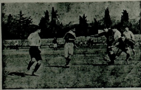
جمعه برلیکی ایاق طوبی ادمانلری فوطوغوردک

قایتنه [سقوت] ک حال نزعنده اسباب فلاکتی یازهرق اخلافه براقاسی آز بیوکک ، آزمتامیدر .. قایتنه [سقوت] ورفقای فلاکتک کوستردکلری منانت برتمال تشکیل ایده جک ماهیتدهدر . ایشنه قطب قهرمانک جسدی یاننده بولنان دفترسیاحتی بزهبوجور آدملاک اوشرفلی قدرلری نقل اییدیور . یالکزر بونک تفصیلنه باشلامه دن اول کرک ووقعه نک محلی ، کرکه تشبک شکل واهمیتی حقنده بر فکر مجمل حصولی ایچون برقاچ سطر تفصیلات استادییه ویره جکزر :