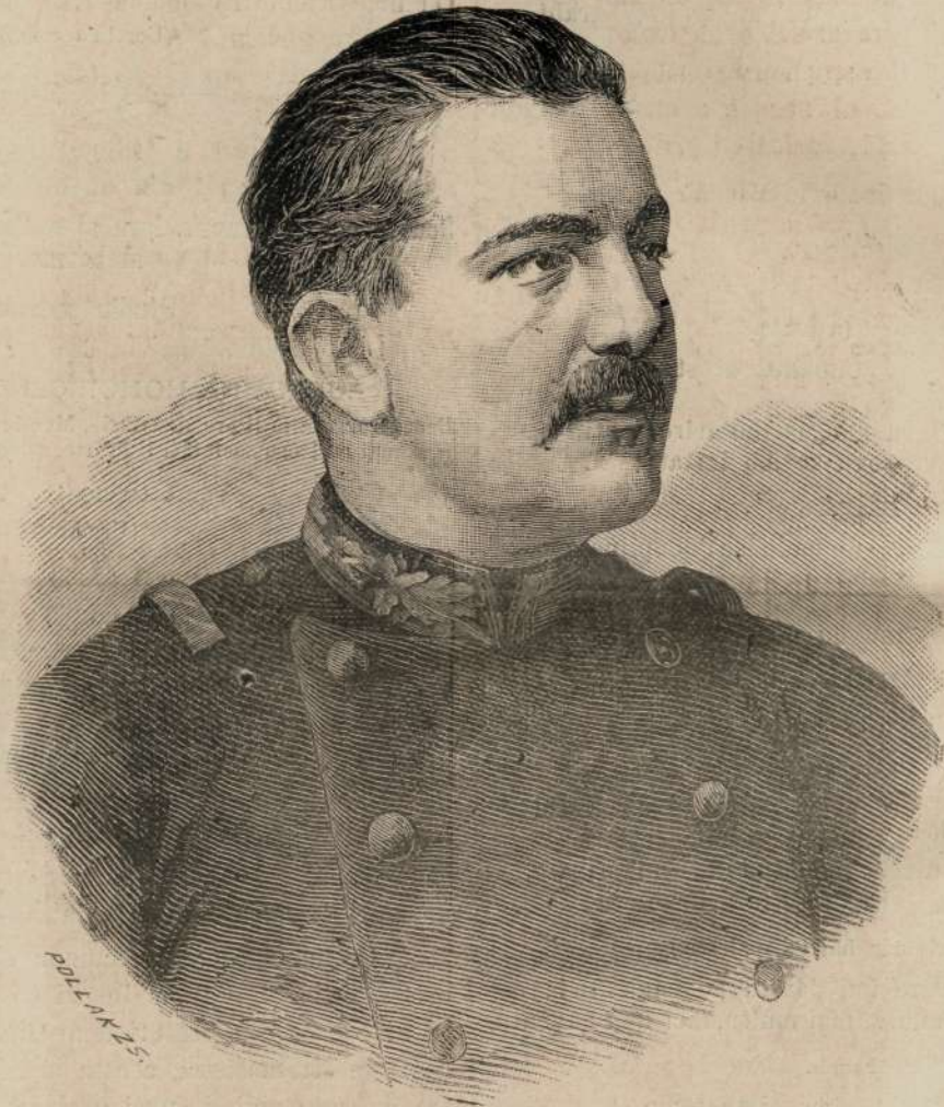
MILAN REGELE SERBIEI.

copilului la implinirea anului, cându i se frânge turt'a in capu si a-deca: Cându copilulu e de unu anu parintii facu o turta mare ori unu „pan-d'Españ“ (pain d'Espagne) si invita pe nasi si pe cunosciintie. Nasiul séu nasi'a iá pe copilu si-lu pune de-asupr'a unei cofe cu apa séu cu vinu frumosu imodobita inaintea unei mese pe care se punu cărti de studiu, de jocu, arme, bani, si altele asemenea de e baétu, si-lu lasa se-si aléga cev'a. Déca iá o sabie va devení unu militaru, déca iá cărti de jocu unu cartoforu, déca iá bani,