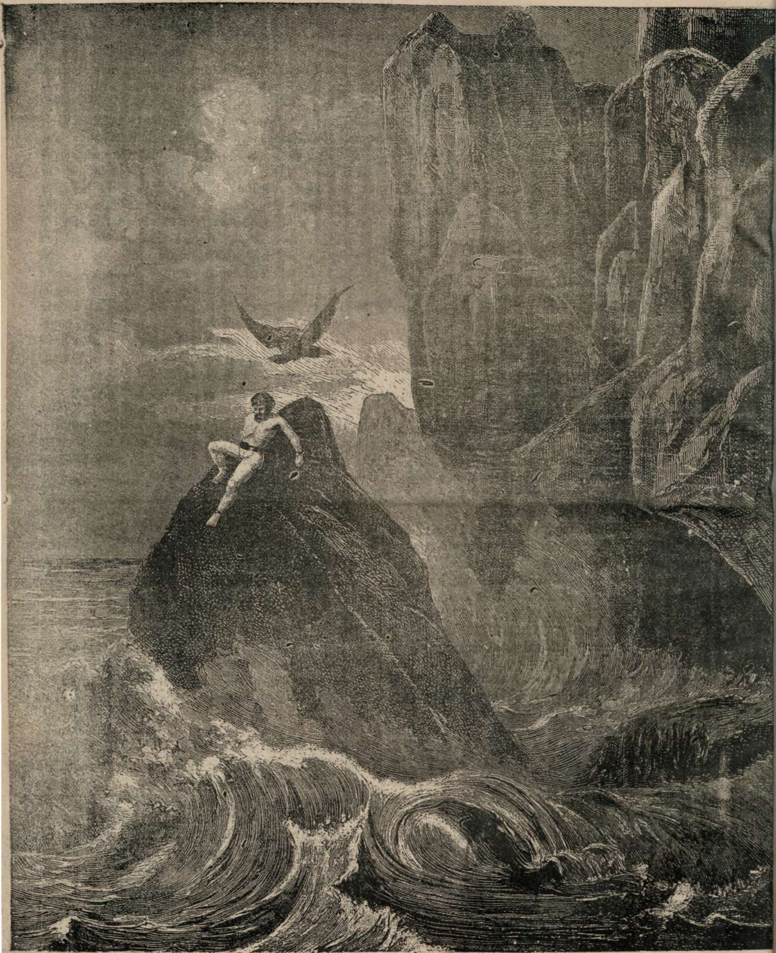
PROMETHEU LANTIUITU DE STANCA.