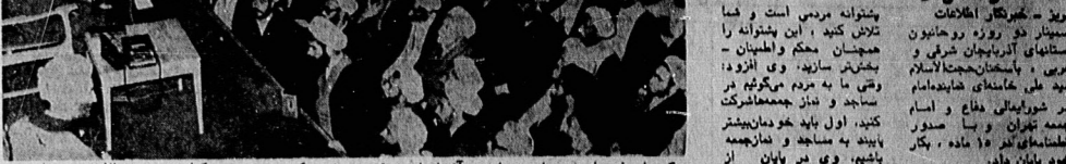
گروهی از جلسه سمینار روحانیون آذربایجان شرقی و غربی که در تبریز، برگزار شد. حجت‌الاسلام سیدعلی خامنه‌ای نماینده امام در شورای ملی دفاع و امام جبهه میمنه، در حال سخنرانی در آخرین جلسه سمینار، در مشهد بودند.

اینکه دشمن از روحانیت مترسد، بفاطر این است که روحانیت، دزای پشتوانه مردمی است. شرکت کنندگان در سمینار، ضمن پشتیبانی از ملت‌های مستضعف خواستار تشکیل جمهوری اسلامی در کشور عراق شدند.