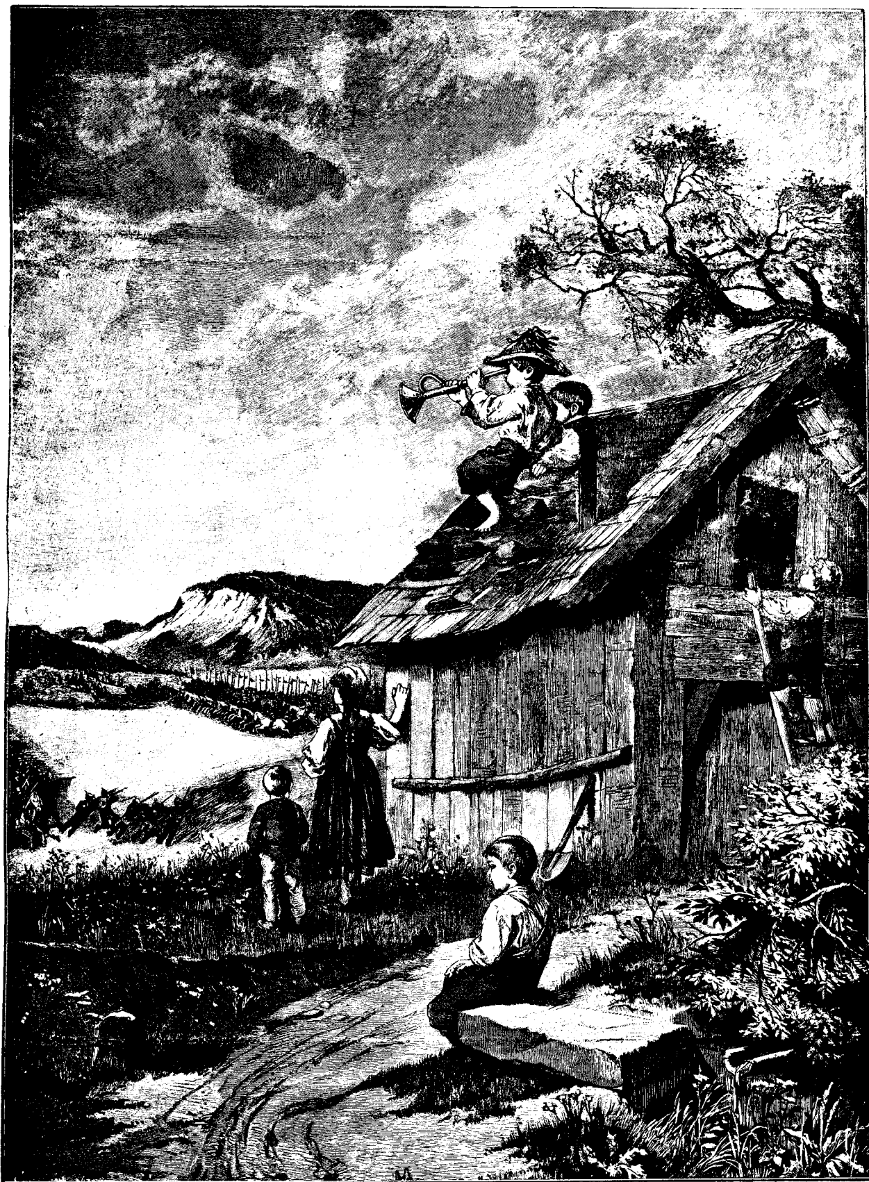
L A M A N E V R E.