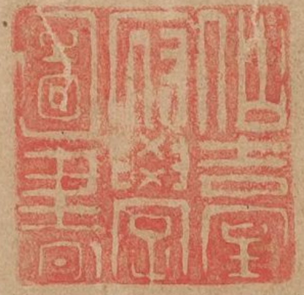
圖 文 合 攷 拾 冊