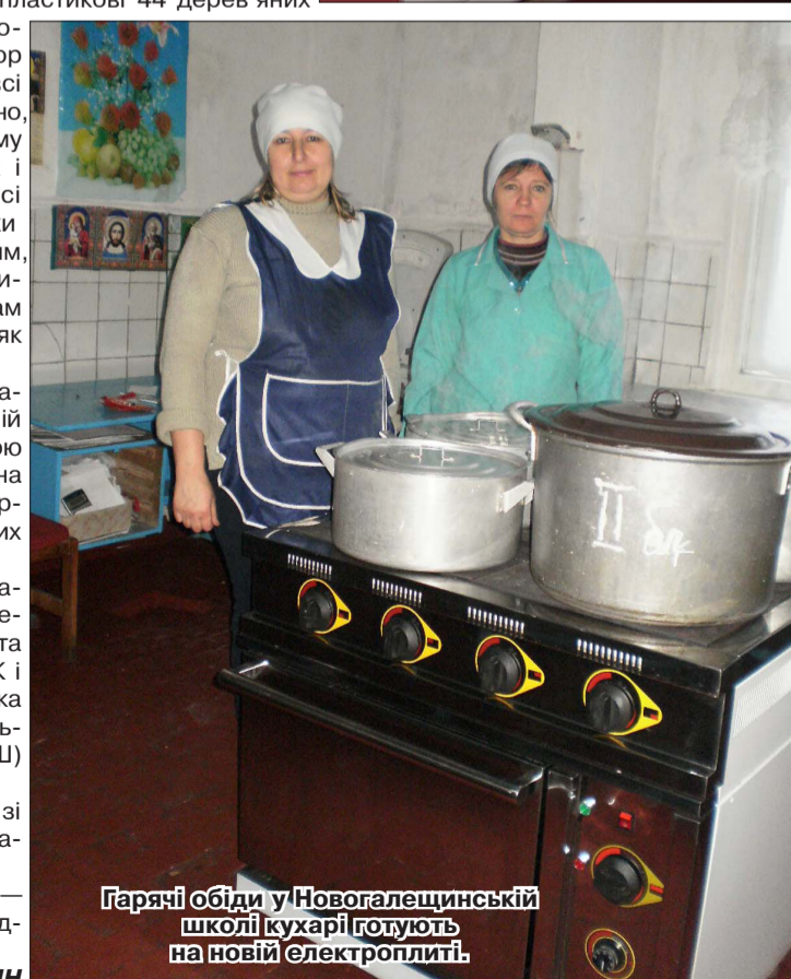
Гарячі обіди у Новогалещинській школі кухарі готують на новій електроплиті.