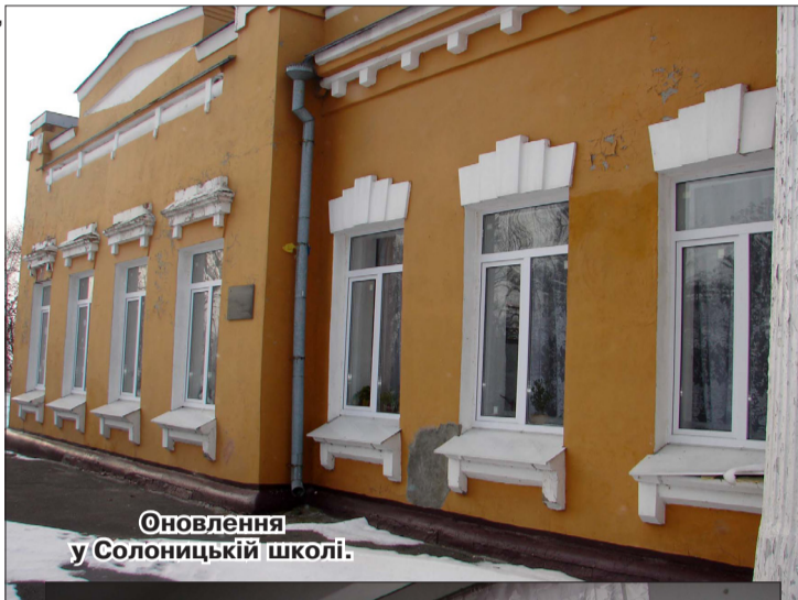
Оновлення у Солоницькій школі.