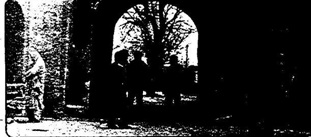
در روزی قلعه

امام خمینی: حقوق مردم معروم، که عمری است مالکین و سرمایه‌داران پزرت‌خورده‌اند، به معر و مین باز پس داده می‌شود