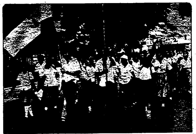
دانش آموزان و دانشجویان نیکار اگوئه عازم شرکت در میتینگ عظیمی هستند که کناران علیه بیسوادی را آغاز کرد.

است. «جبهه ضد بیسوادی برای آزادی ملی» زمینداران و کارفرمایان خرد می بقیه در صفحه ۶