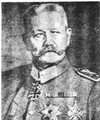
歐戰初起時第八路軍 總指揮興登堡將軍

是德國軍事的屈膝，其中原因也實在太多。可是興登堡已被世人譽謂天才的軍事家，而被世界軍人作為偶像的崇拜了。雖則就是霞飛，福煦，亞爾塔諾元帥，也同樣是大戰中不朽的人物，可總不及興登堡那怎的宏才浩力。