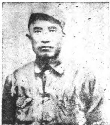
抗日第八路軍總指揮朱德將軍

在世界第二次大戰的前夜，我們洗心靜腦來詳讀世界第一次大戰史，我們不作任何戰術方面的庇護者，我們站在旁觀者的地位，來詳細研究德國所以能夠維持五年戰爭的總因，這裏，我們發現了興登堡軍事天才的運用了，他是少數的