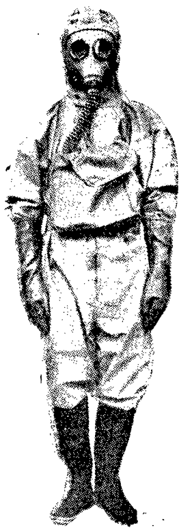
← 全身防毒衣預備在 炮火下活動的勇士