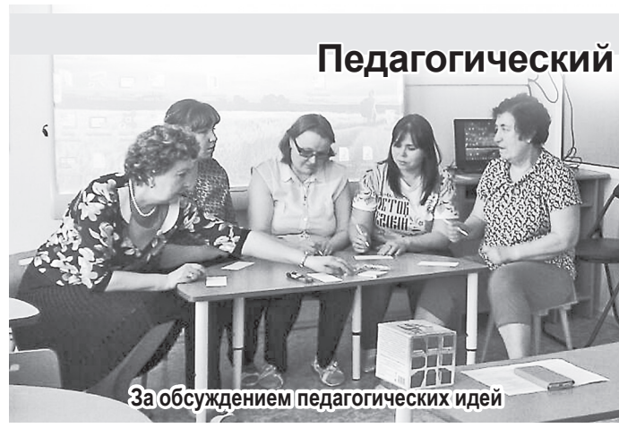
За обсуждением педагогических идей