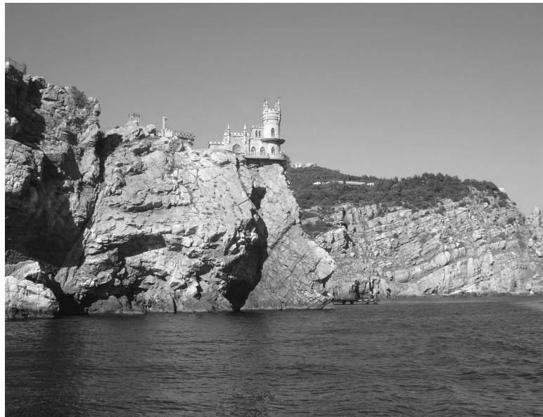
«Ластівчине гніздо» – своєрідна візитівка Кримського півострова

Зокрема, Верховною Радою України 18 січня 2018 року було ухвалено Закон України «Про особливості державної політики із забезпечення державного суверенітету України на тимчасово окупованих територіях