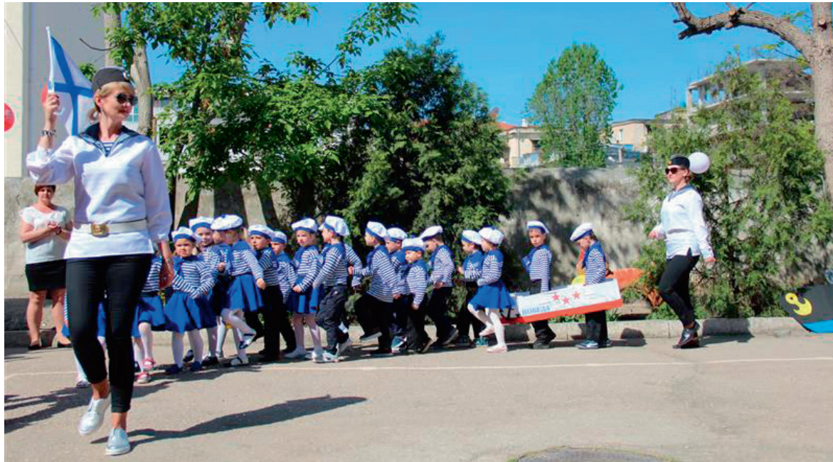
Так званий «святковий військовий парад» дошкільнят відбувся на початку травня 2019 року в дитячому садку № 24 м. Севастополя

Російська військова присутність у Криму станом на осінь