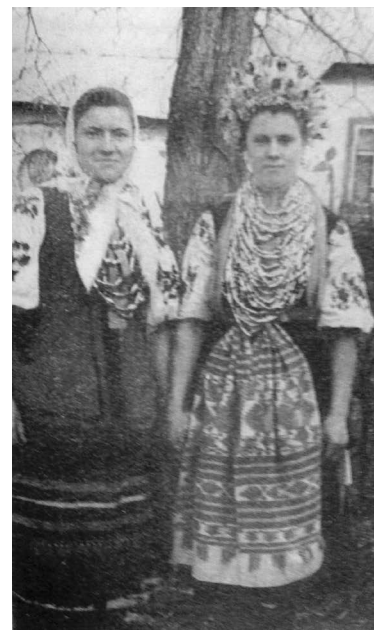
Кримські переселенки з Полтавщини. Наречена з дружкою, 40-50-ті рр. ХХ ст.