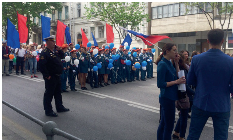
Школярі у військовій формі та формі "Юнармії" 1 травня брали участь у демонстрації у Севастополі