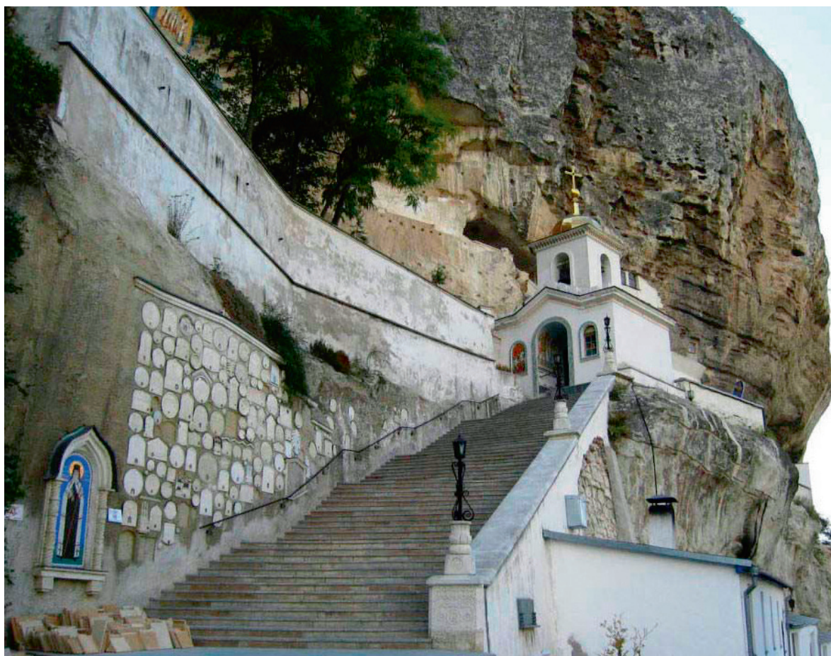
Свято-Успенський чоловічий монастир у Бахчисараї

М іністерство культури України нарахувало на території Криму більш