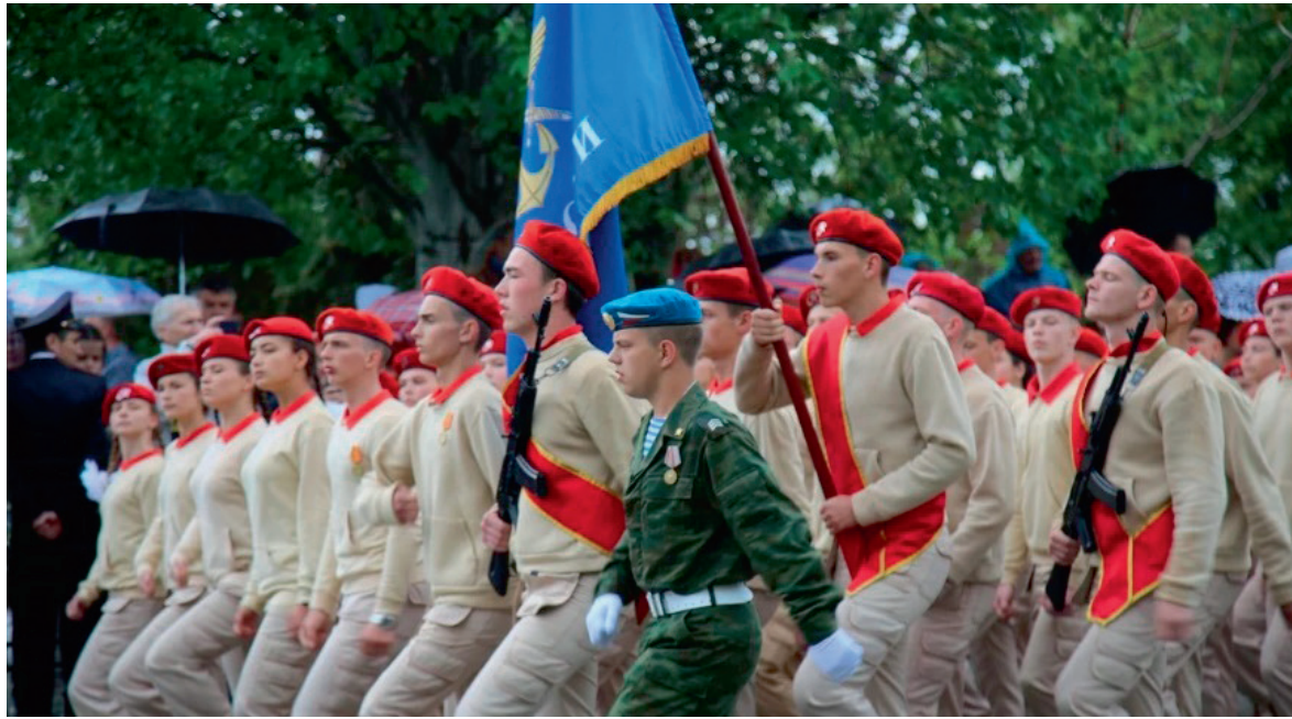
Військовий парад у Керчі 9 травня 2019 року за участі молоді та підлітків

Як захистити дітей і що має зробити Україна, аби врятувати їх на окупованих територіях від мілітаризації свідомості, яку Росія проводить там протягом семи