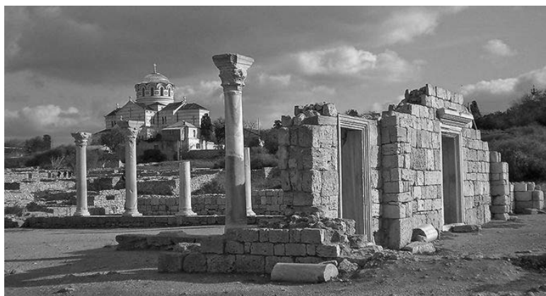
Стародавнє місто Херсонес Таврійський і його хора – один із українських об'єктів Всесвітньої спадщини ЮНЕСКО

терство надало перелік пам'яток національного та місцевого значення, але перелік є неактуальним. Також він не містив жодних згадок пам'яток, які були зазначені на початку цієї статті. Крім того, міністерство не надало мені жодної відповіді на запит, який стосувався зруйнованої чи пошкодженої культурної спадщини. Окрім того, в одній з численних відповідей МКІП додатково мені повідомив, що на сьогодні