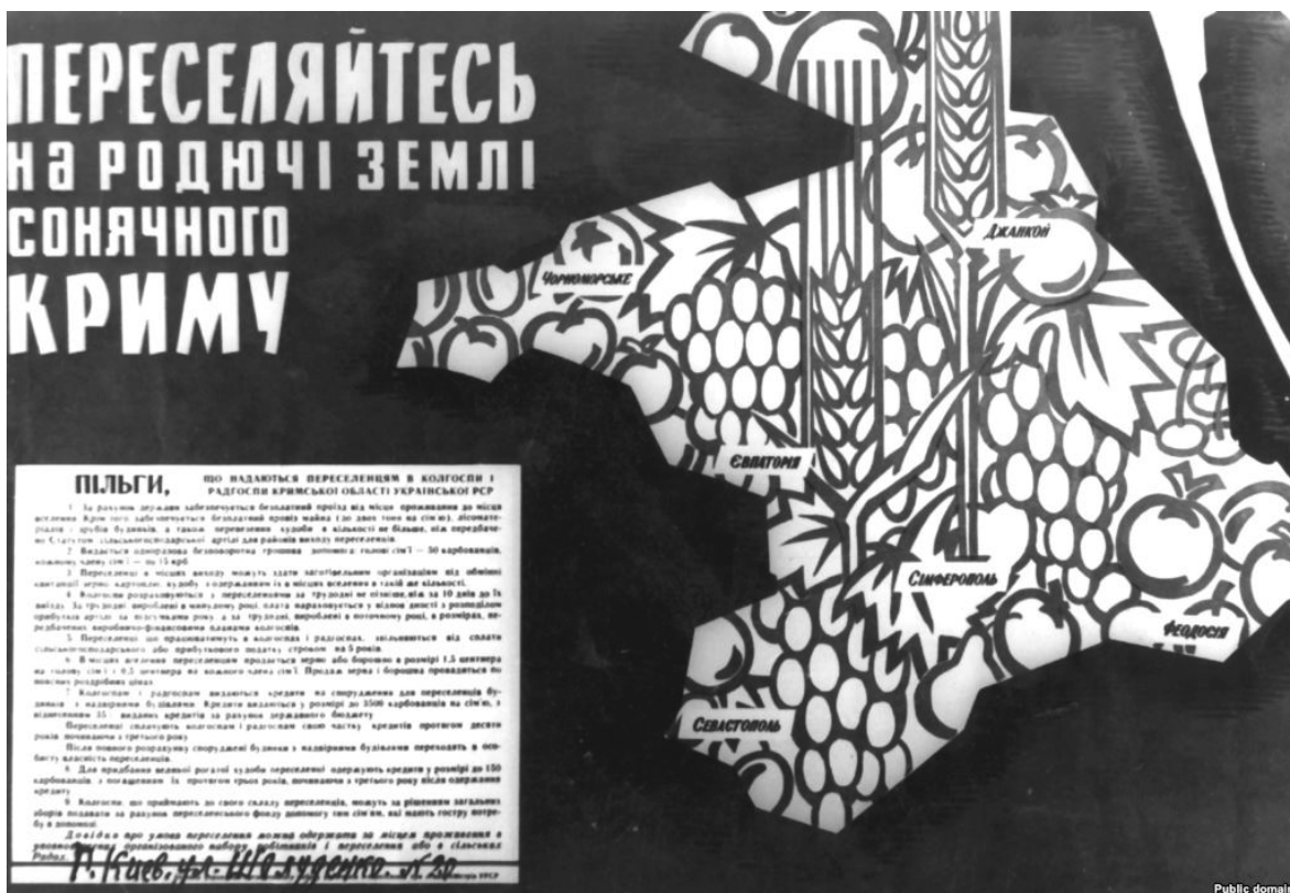
Так агітували українців переселятися до Криму

У січні 1954 р. в Криму з огляду на приплив переселенців з інших українських областей розпочалося відродження української народної освіти – зокрема, впровадження вивчення української мови в школах області. 19 лютого 1954 р. Президія Верховної Ради СРСР видала указ про передачу Криму до складу УРСР. Того ж року на честь «возз'єднання України з Росією» в Сімферополі було встановлено пам'ятник Богданові Хмельницькому на вулиці імені гетьмана. Розпочалася показова «українізація» регіону.