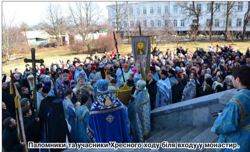
Паломники та учасники Хресного ходу біля входу у монастир.

У центрі Козельщини, поряд із дитячою музичною школою розміщена районна Дошка видатних людей нашого краю. Поряд із академіками М.В. Остроградським, О.Т. Гончаром, І.К. Дряпаченком — фотографія жінки у чорному. Хто уперше проходить повз цю Дошку, обов'язково зупиниться і