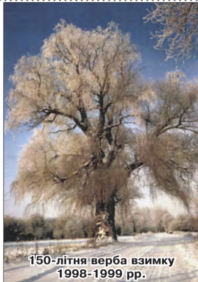
150-літня верба взимку 1998-1999 рр.