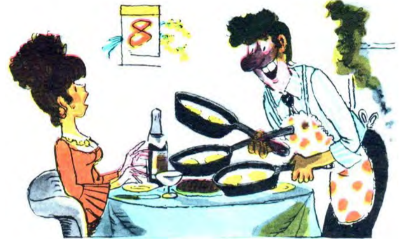
— На честь твого свята я приготував обід із трьох страв!