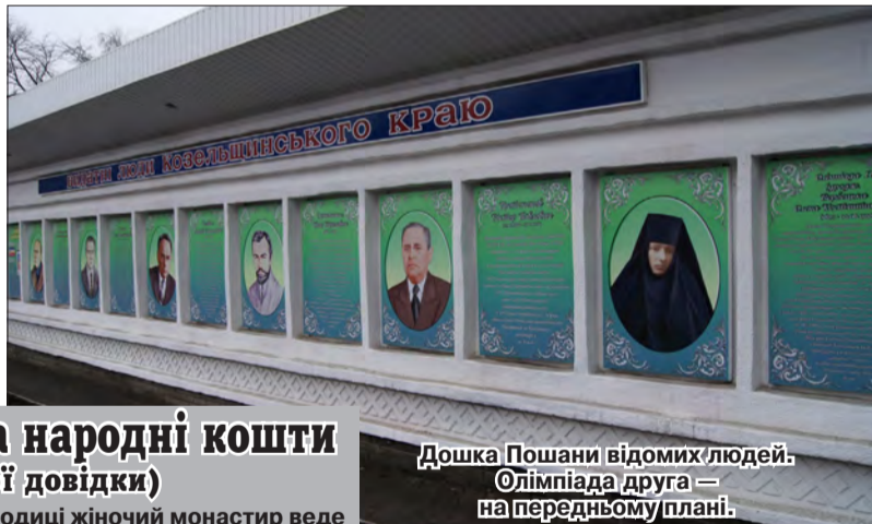
Дошка Пошани відомих людей: Олімпіада друга — на передньому плані.