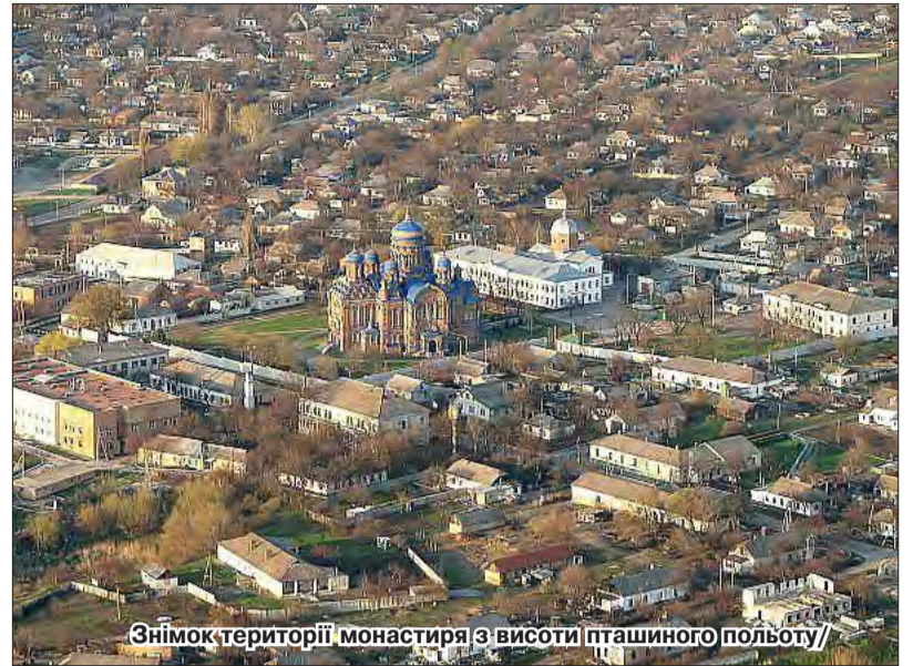
Знімок території монастиря з висоти пташиного польоту