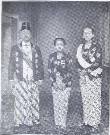
ဤပုံကား အရှေ့-အလယ်တွင် အစိုးရအဖွဲ့ဝင်များနှင့် အနောက်တွင် အစိုးရအဖွဲ့ဝင်များ ပါဝင်၍ ရုပ်ပုံရိုက်ခြင်းဖြစ်သည်။

ပြည်သူ့အဖွဲ့အစည်းတို့၏အားကိုးခံရမှုကို အထောက်အကူပြုရန်အတွက် အစိုးရက နေပြည်တော်၌ အစည်းအဝေးကြီးကြီး ပြုလုပ်ခဲ့သည်။