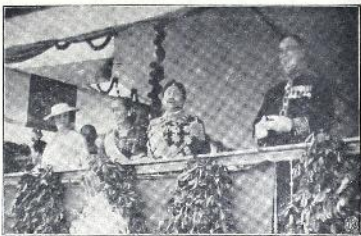
၂၂၀၇၀၀၀ အထွတ်ထွေ သဘောထား၍ ဆုံးဖြတ်နိုင်ရန် တောင်းဆိုလျက် ရှိသဖြင့် ထိုသို့ ဆုံးဖြတ်ပေးရန် တောင်းဆိုလျက် ရှိသဖြင့်

ယင်းမှ တစ်ဖက်တစ်ပါး ဟူ၍ အထွတ်ထွေ သဘောထား၍ ဆုံးဖြတ်နိုင်ရန် ဆုံးဖြတ်ပေးရန် တောင်းဆိုလျက် ရှိသဖြင့် ထိုသို့ ဆုံးဖြတ်ပေးရန် တောင်းဆိုလျက် ရှိသဖြင့်