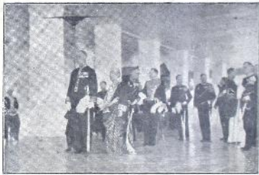
၂၂၀၇၀၀၀ အထွတ်ထွေ သဘောထား၍ ဆုံးဖြတ်နိုင်ရန် တောင်းဆိုလျက် ရှိသဖြင့် ထိုသို့ ဆုံးဖြတ်ပေးရန် တောင်းဆိုလျက် ရှိသဖြင့်