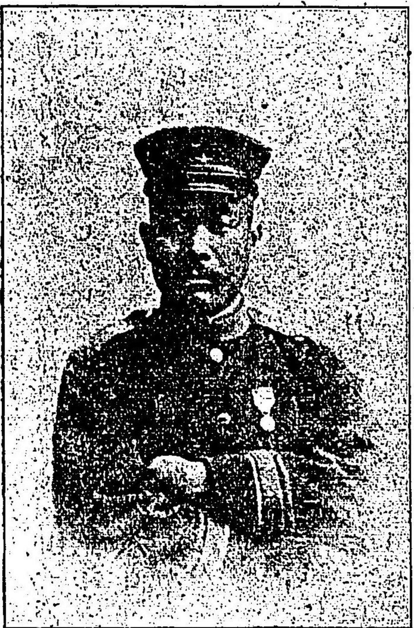
君 郎 太 源 澤 塩

ノ爲メ今十月廿三日屯營出發全十一月十三日大阪港出帆玄海難波濱高ノ海上七日間ニ 涉リ全十九日清國盛省青泥窪ニ上 陸シ旅順包圍軍ニ加ハリ全廿八日 午後七時草寢岩枕シ彈丸崩烟ノ裡 ニ出入シ而モ難攻不落ト稱シタル 二〇三高地突入ノ際左季助部督管 銃劍ヲ受ケ衛生隊ヲ經テ野戰病院 へ入院遂次還送回卅八年一月廿三 日東京豫備病院ニ於テ傷癒治癒退 院全二十六日歩兵第二十六聯隊補 充大隊へ編入金十四月二十二日歩 兵伍長ニ任ス次ラ武器掛リヲ命セラル同年平和克復ニ付十月廿六日召集解除