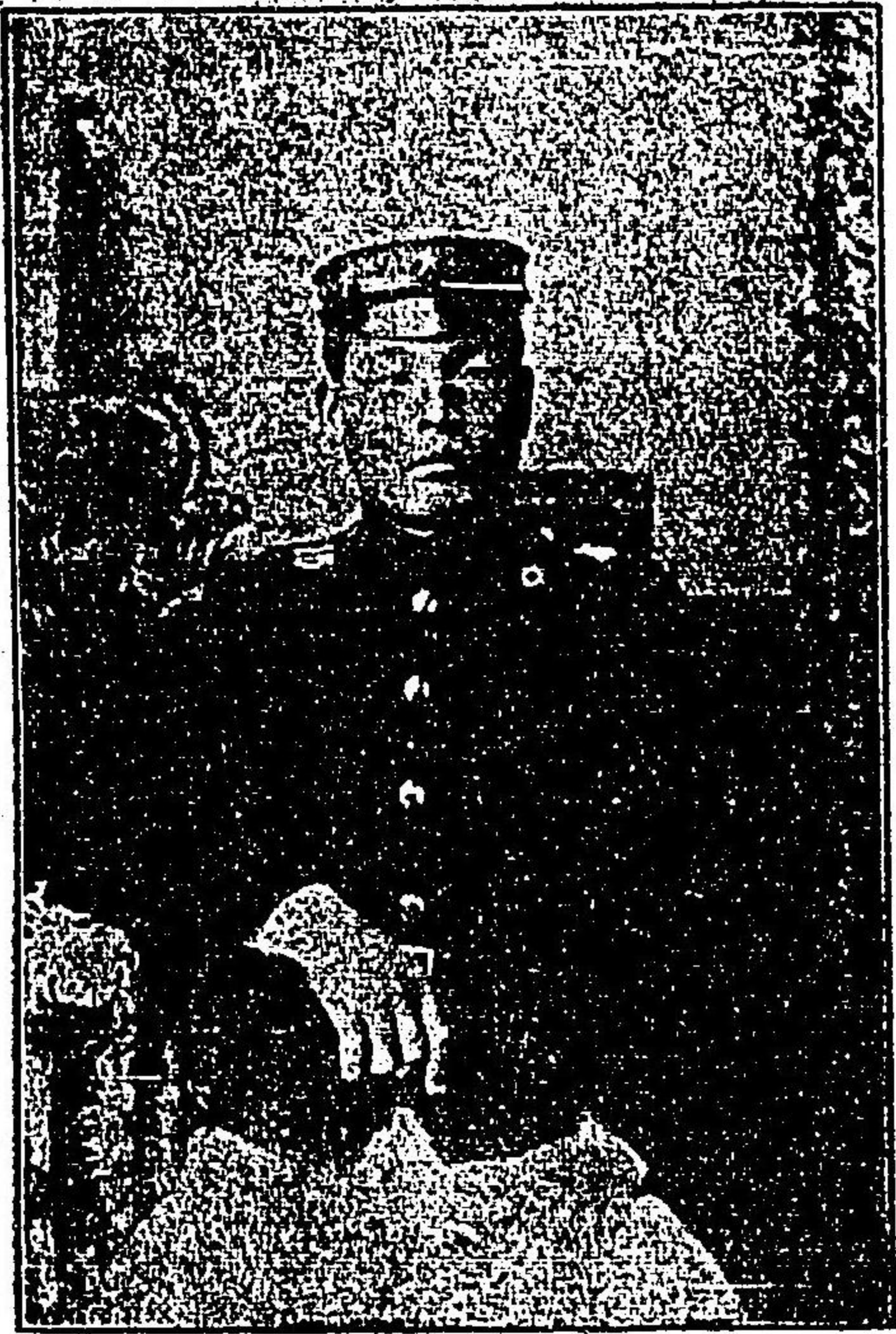
右 郎 太 丑 下 宮

明治廿七年三月十四日宇品港出帆三月十五日韓國鎮南浦上陸、同五月一日九連城及蛤 蟆塘ニ戰闘同六月廿 九日蘭花峯ニ戰闘同 七月廿一日及八月一 日様子峯附近ニ於テ 戰闘同八月廿六日乞 峯寺ニ於テ戰闘全八 月廿一日除家溝ニ戰 闘全年十月十一日十 二日老若谷北方高地 ニ於テ戰闘全月十三 金鷄勲章年金百圓ヲ下賜セラル