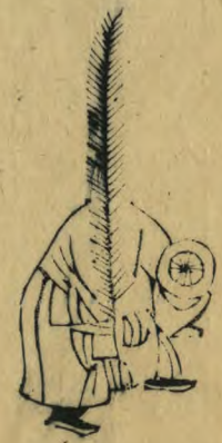
肅 俯身偏外起外 足羽籥如十字