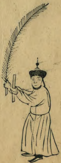
秋 內向兩手伸 出羽籥植