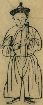
鋪 正立籥植 羽倒指東