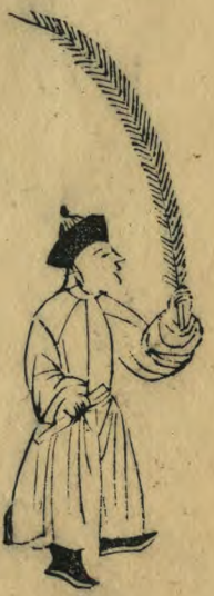
豆 向外籥下垂右 手伸出羽植