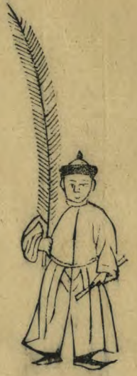
自正立簫下 垂羽植