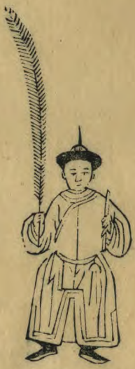
予 正立羽 簫植