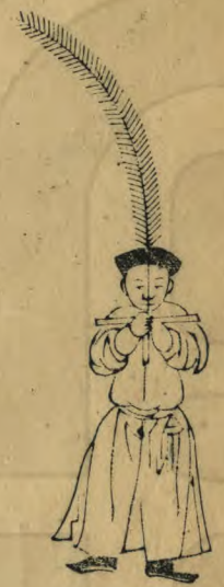
明 正立兩手微供 羽簫如十字