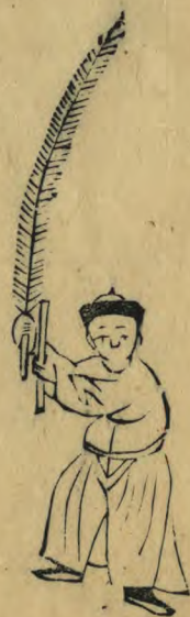
陶 正面身作向東勢兩手 高舉羽籥推向東並植