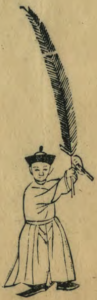
論 正面身作向外勢兩手 高舉羽簫斜交偏外