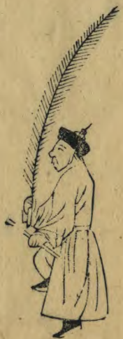
禮 內向內足虛立 籥斜倚膝羽植