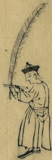
肅 內向首微俯兩足 並羽籥如十字