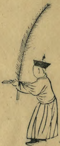
清 內向兩足並簫內 指羽植如十字