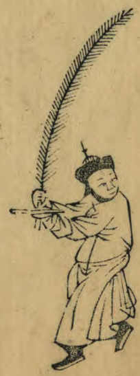
懷 身作向內勢內足勾後面轉 向外簫指內羽植如十字