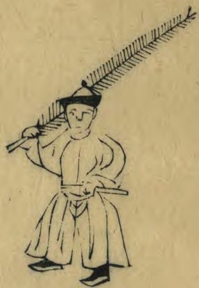
禮 身微向東右足進前 羽倚肩籥平指東