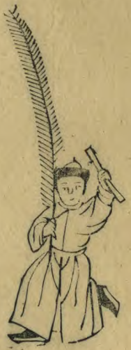
皮 正面左足勾後籥 斜舉過肩羽植