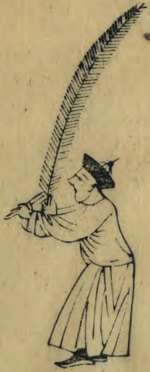
愆 內向起內足兩手 並推向外羽籥植