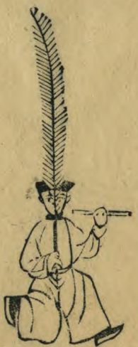
弁 正面屈右足左足伸出趾 向上籥平舉羽植居中