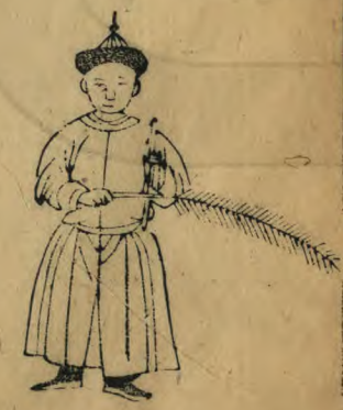
德 正立簫植近肩 羽平行如十字