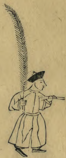
彝 外向箭平 指外羽植