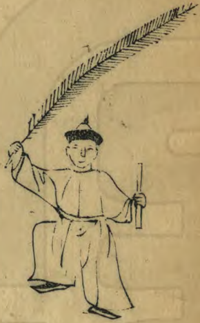
斯 正面起右足 羽高舉籥植