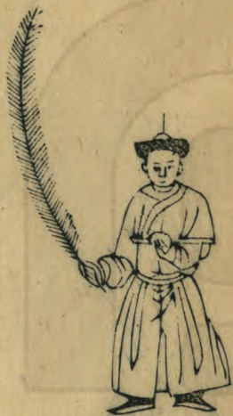
既 正立簫平衡 羽斜指東