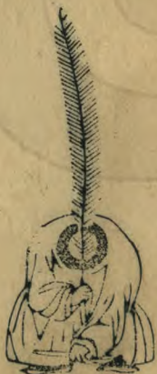
載 正立身俯簫平衡 羽居中植簫上