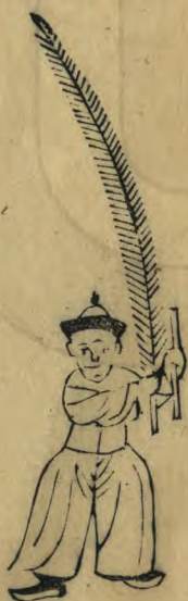
淑 正面身作向西勢兩手 高舉羽籥推向西並植