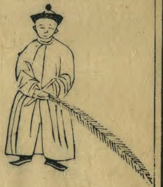
響 正立羽籥 向下斜交