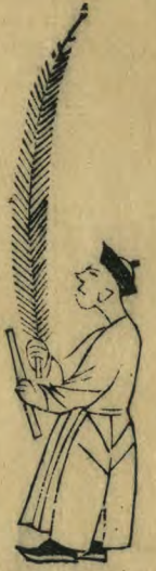
於 內向兩手相並 羽簫斜指內