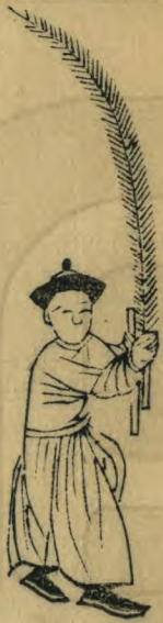
蕝 正面身向外內足進前 外趾虛立羽籥並植