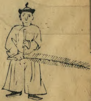
彥 正立籥植居 中羽衡籥下