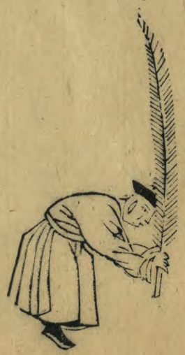
古向外身俯兩足 並羽簫斜交