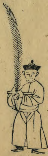
倫 正立羽箭偏 內如十字