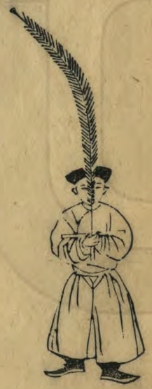
古 身微向外羽籥 偏外如十字