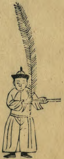
髦 正立左手伸出籥 平舉羽植近左肩