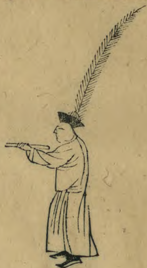
展 內向兩足並 箭內指羽植