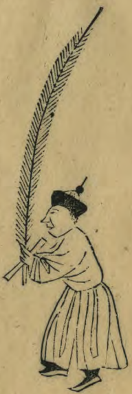
民 內 向 簫 斜 指 羽 植