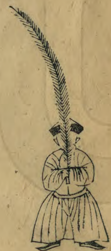
成 正面身微蹲 羽箭如十字