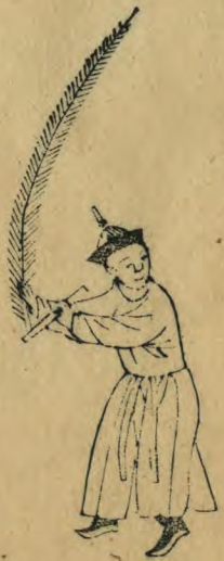
振 身俯向東面轉向西 兩手伸出羽簫斜交