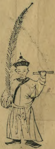
有 正 立 簫 平 舉 過 肩 羽 植