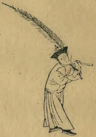
玉 向西首微側右足進 前簫平指西羽斜舉