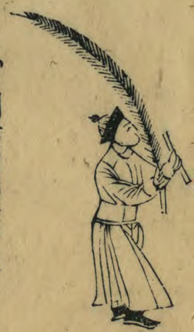
也 外向面仰兩手 推出羽箭斜舉