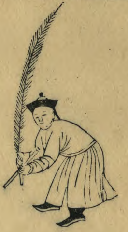
俎 向內身俯內足進 前籥斜指下羽植