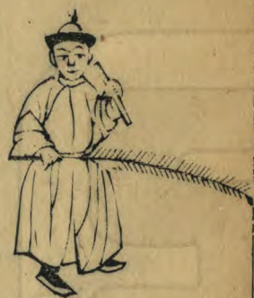
樂 身微向西左足進前 籥倚肩羽平指西