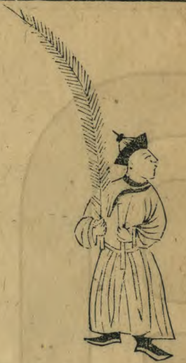
未 正 立 面 向 外 兩 手 相 並 推 向 內 羽 簫 植