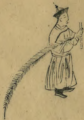
生 外 羽 倒 指 內 少 垂 並 簫 植