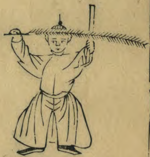
春 正面身微蹲籥植過 肩羽平額交如十字