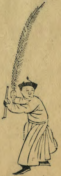
協 正面身向內外足進前 內趾虛立羽籥並植