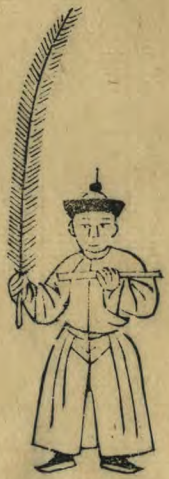
譽 正立籥平舉右手 手微伸出羽植