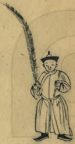
千 正立籥斜 舉羽植