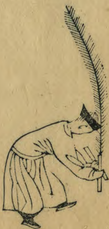
酒 身俯向外外足進前 趾向上羽簫斜交