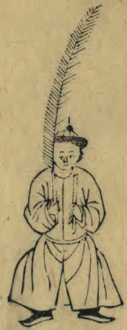
式 正面身微蹲兩 手並羽籥植