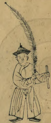
大 身微向外兩手推 向外羽箭並植