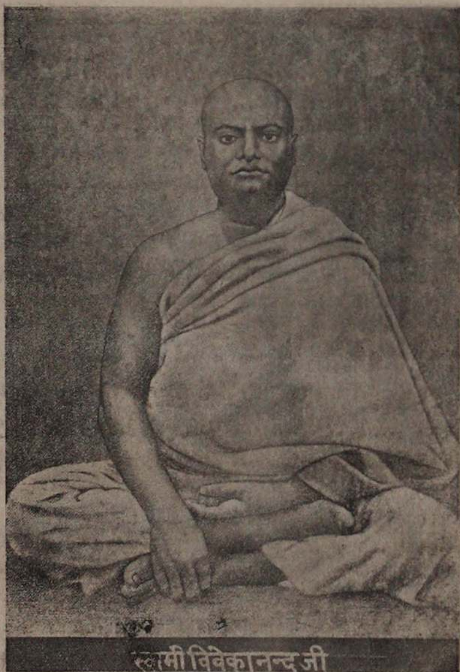
स्वामी विवेकानन्द जी