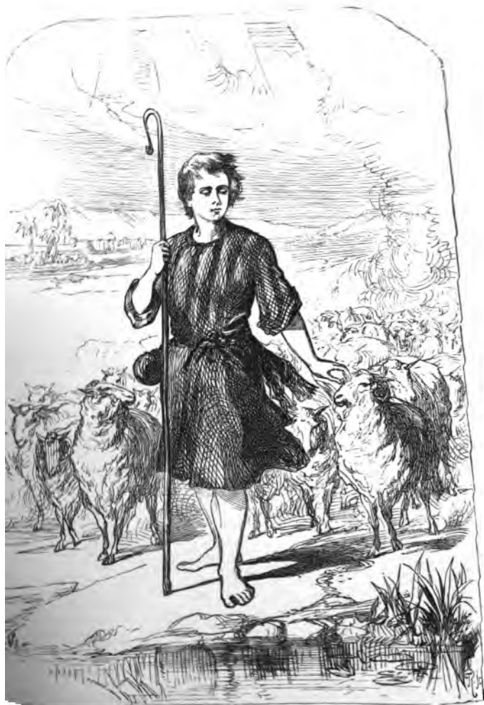
BUGAIL IEUANG BETHLEHEM.