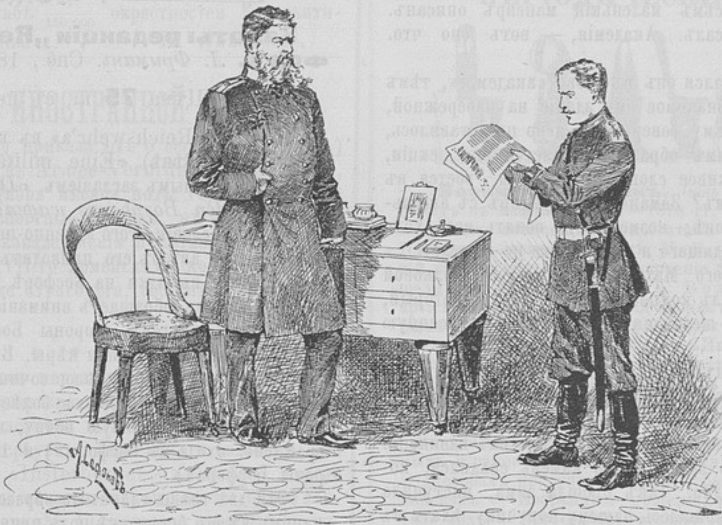
Это вы писали?

Въ одно, далеко не прекрасное, утро адъютантъ прислалъ поручику Махову записку о томъ, что командиръ полка требуетъ его для объясненія