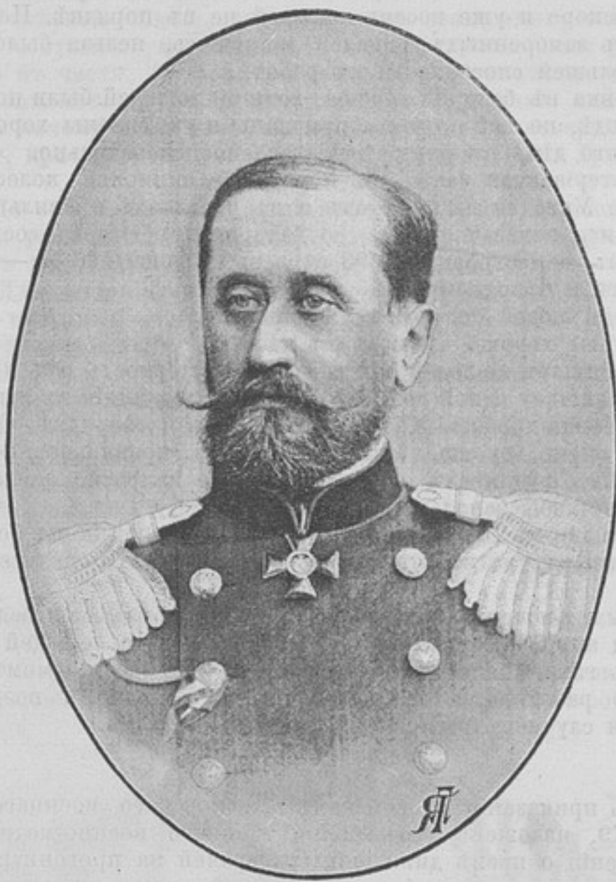
Начальникъ 1-й Закаспійской стрѣлковой бригады, Генераль-Маіоръ