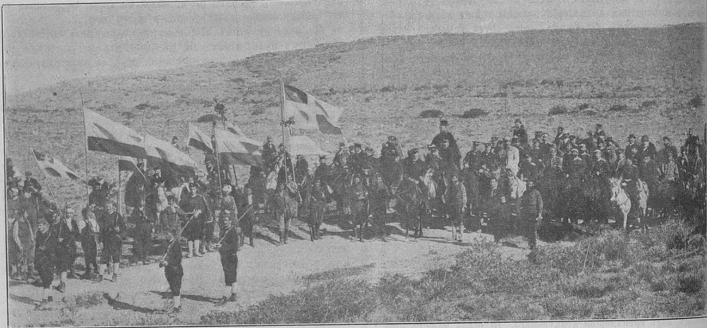
Обратное слѣдованіе королевича Георгія изъ монастыря «Аркадія» въ Реттимо (къ корреспонденціи «Реттимо»).

Въ № 422 за 1899 годъ журнала «Развѣдчикъ» поставленъ на разрѣшеніе вопросъ о вѣроятномъ происхожденіи стекляннаго ядра, въ 3 1 / 2 дюйма діаметромъ, найденнаго на глубинѣ 8—9 вершковъ, при подъемѣ цѣлины генераломъ Рынкевичемъ. Совершенно подобное ядро, діаметромъ 3 3 / 4 дюйма, нѣсколько сплюснутое, изъ темно-зеленаго стекла, вѣсомъ 1 1 / 2 фунта, имѣется въ моей коллекціи и найдено близъ мѣстечка Городыщи (Минской губерніи). Наружный его видъ слѣдующій: