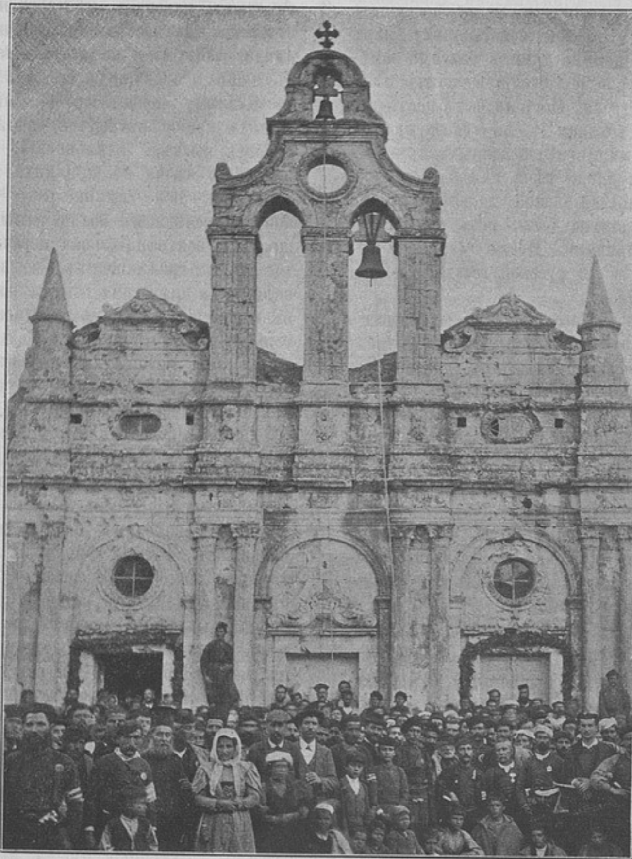
Монастырь «Аркадія», посѣщенный Его Королевскимъ Высочествомъ 16-го января 1899 г. (къ корреспонденціи «Реттимо»).