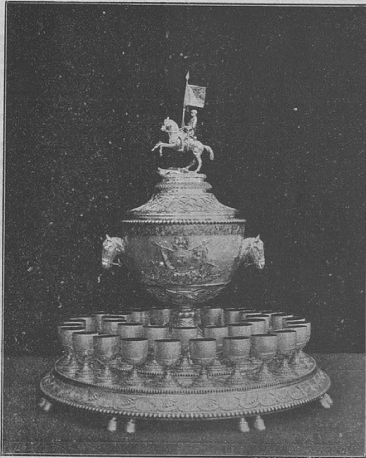
Полковая братина 43 драг. Тверскаго полка (къ статьѣ «Столѣтній юбилей Тверскихъ драгунъ»).

«Г. Кирѣевъ, пространно трактуя о пощечинахъ, упустилъ изъ виду, что въ моемъ очеркѣ ударъ по лицу былъ нанесенъ безсознательно , въ опьянѣніи, и безъ всякаго намѣренія нанести оскорбленіе своему другу.